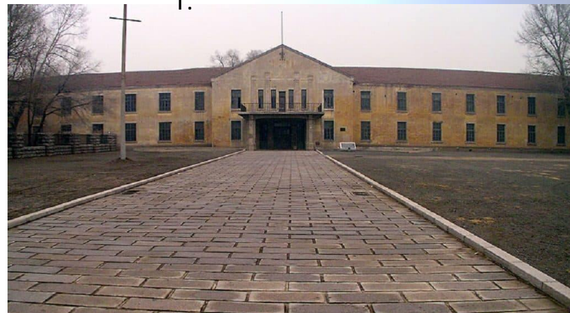
Здание где находился отряд 731 2014 г.