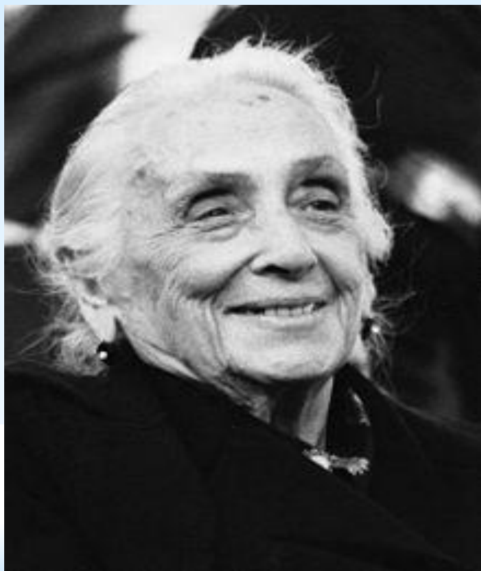
Долорес Ибаррури (1895-1989)