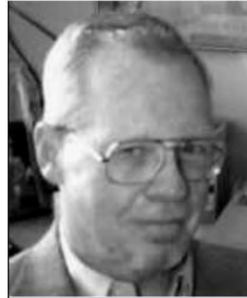
Оливер Итон Уильямсон (род. 1932)