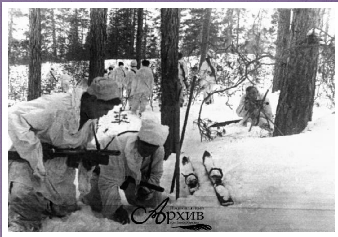
Минирование лыжни бойцами отряда «Красный партизан». Карельский фронт. 1943 г.

Своими действиями партизаны вынуждали врага отвлекать с фронта для усиления охраны тыловых объектов и коммуникаций значительные силы, морально изматывали противника. Это была большая помощь воинам Карельского фронта в их борьбе с немецкими и финскими захватчиками на Севере.