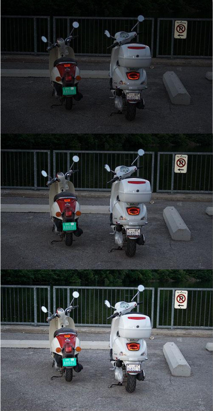
Фото стало заметно лучше.

3. Вы можете повторять этот шаг, сколько нужно, пока не добьетесь нужного результата. Мне кажется, что моей фотографии нужно еще немного света, поэтому опять копируем и изменяем режим наложения на Screen.