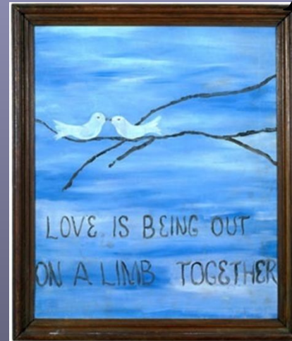
Неизвестный автор «Любовь – это рассвет, встреченный на ветвях вдвоём