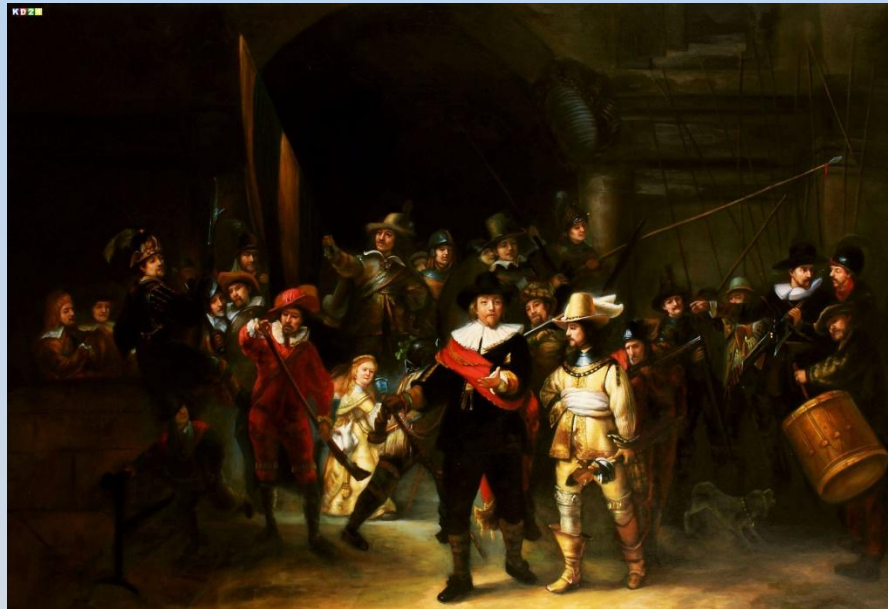
Рембрандт "Ночной дозор"

В Рейксмузеуме находится 20 картин Рембрандта , больше, чем в других музеях мира (коллекция уступает лишь эрмитажной – 26 картин). Включая самое знаменитое произведение, характеризующее Золотой Век – «Ночной дозор» Рембрандта (1642 г.).