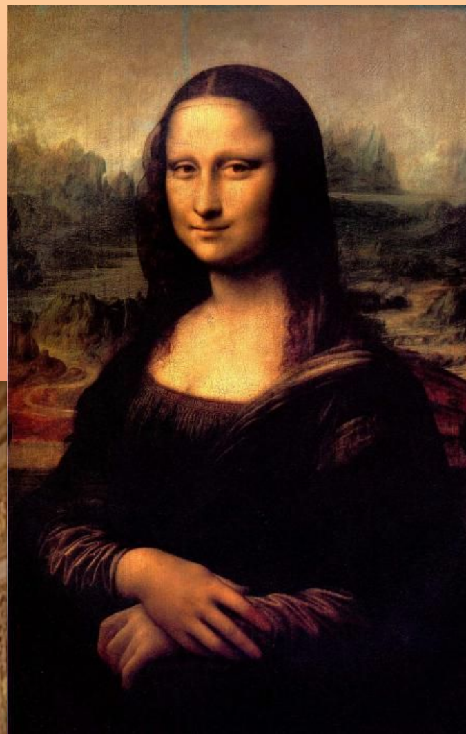
Джоконда (Мона Лиза).