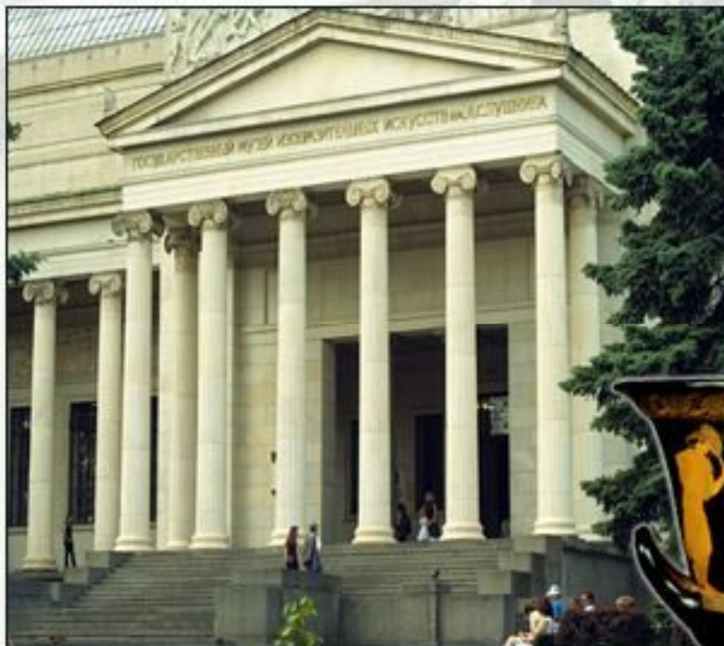
The Pushkin Museum of Fine Arts