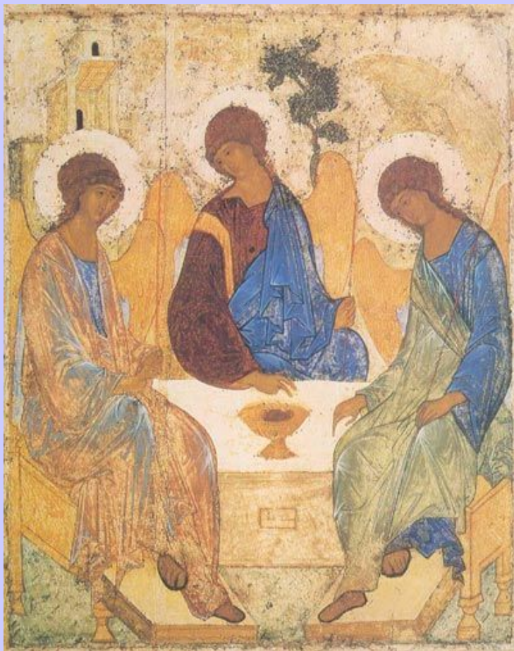
Андрей Рублев. Троица. Первая четверть XV в

Собрание Третьяковской галереи насчитывает более 100 тысяч экспонатов.