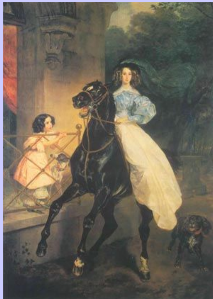
Карл Павлович Брюллов. Всадница. 1832