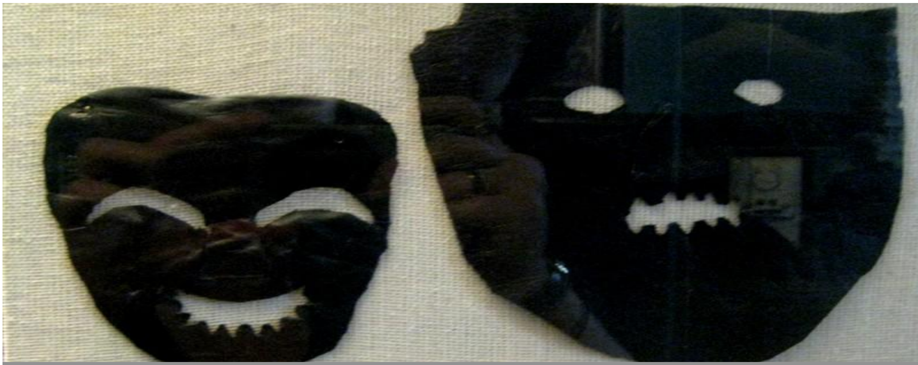
Маски скоморохів зі шкіри, знайдені у Великому Новгороді