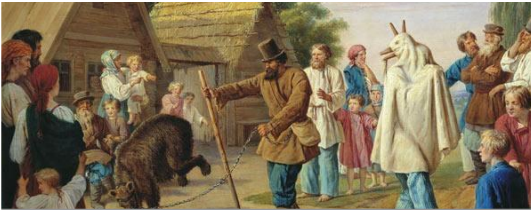
Скоморохи з ведмедем