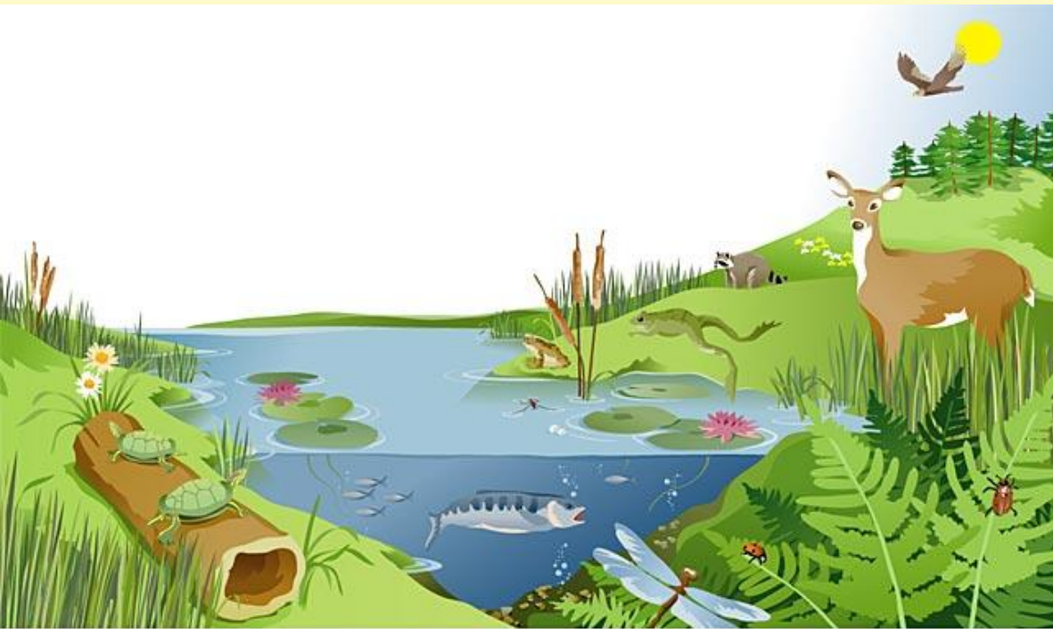
illustration by Jeff Grader / property of Delta Education