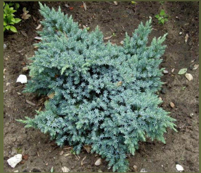
Можжевельник чешуйчатый - squamata