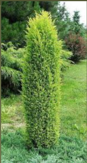
Можжевельник обыкновенный - communis