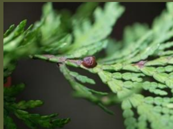
Туевая ложнощитовка - Parthenolecanium fletcheri