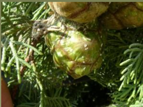
Кипарисовая щитовка - Carulaspis juniperi