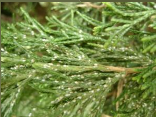
Можжевельниковая щитовка – Carulaspis juniperi