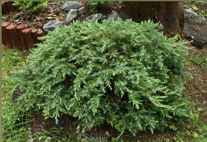
Можжевельник прибрежный - conferta