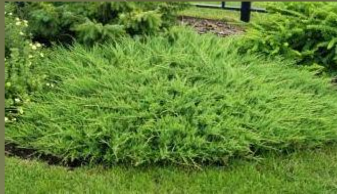
Можжевельник казацкий – sabina