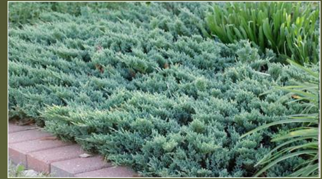
Можжевельник горизонтальный - horizontalis