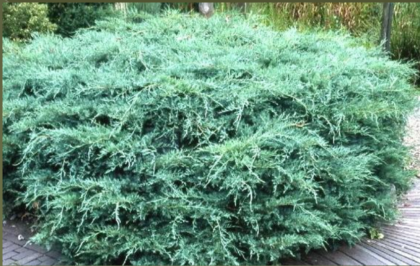
Можжевельник средний – media