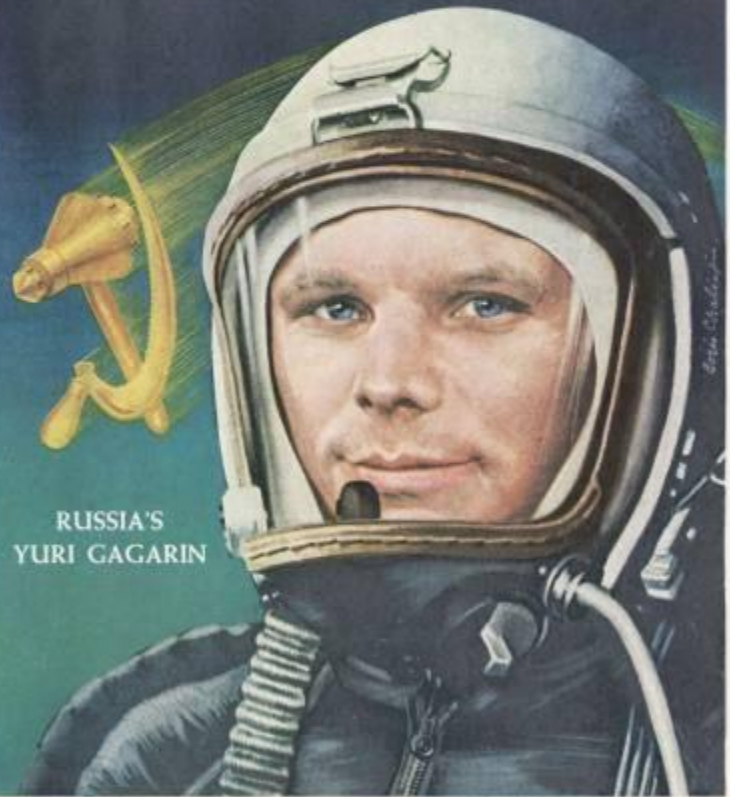
RUSSIA'S YURI GAGARIN