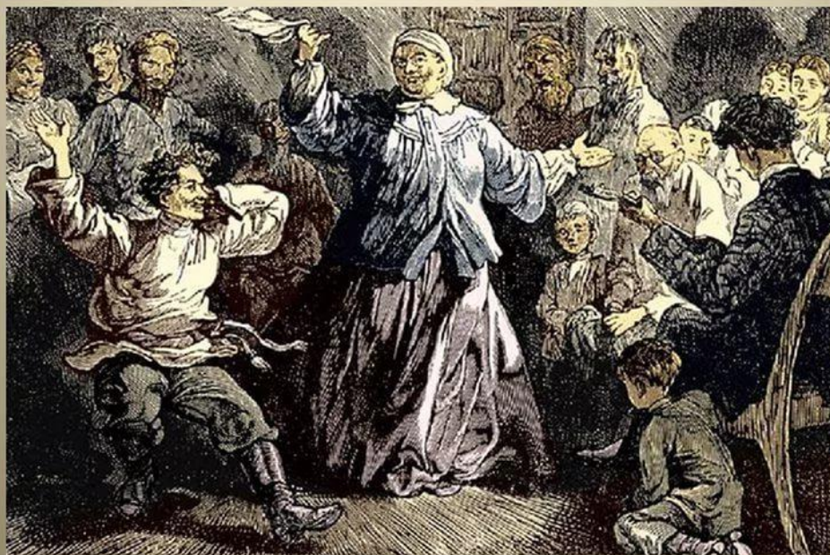
Иллюстрация художника Б. А. Дехтерева к повести М. Горького «Детство»