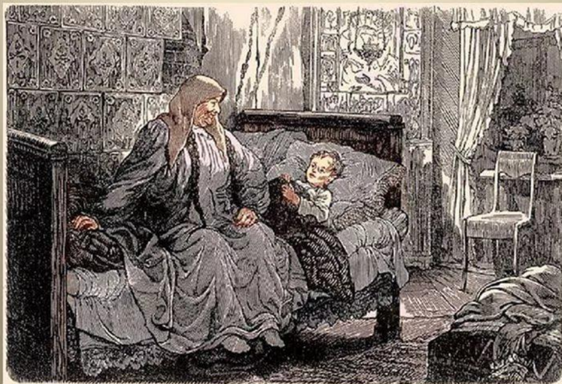
Иллюстрация художника Б. А. Дехтерева к повести М. Горького «Детство»