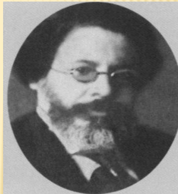
Михаил Иванович Зощенко