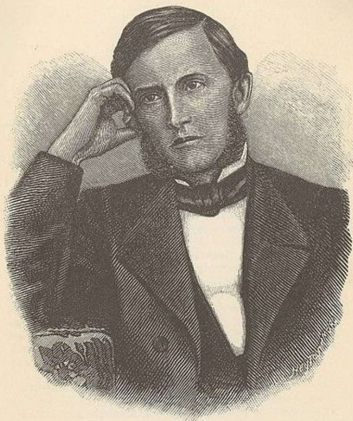
К. Д. УШИНСКИЙ. 1859 г.

«Наше Отечество, наша Родина – матушка Россия. Отечеством мы зовём Россию потому, что в ней жили испокон веку отцы и деды наши»