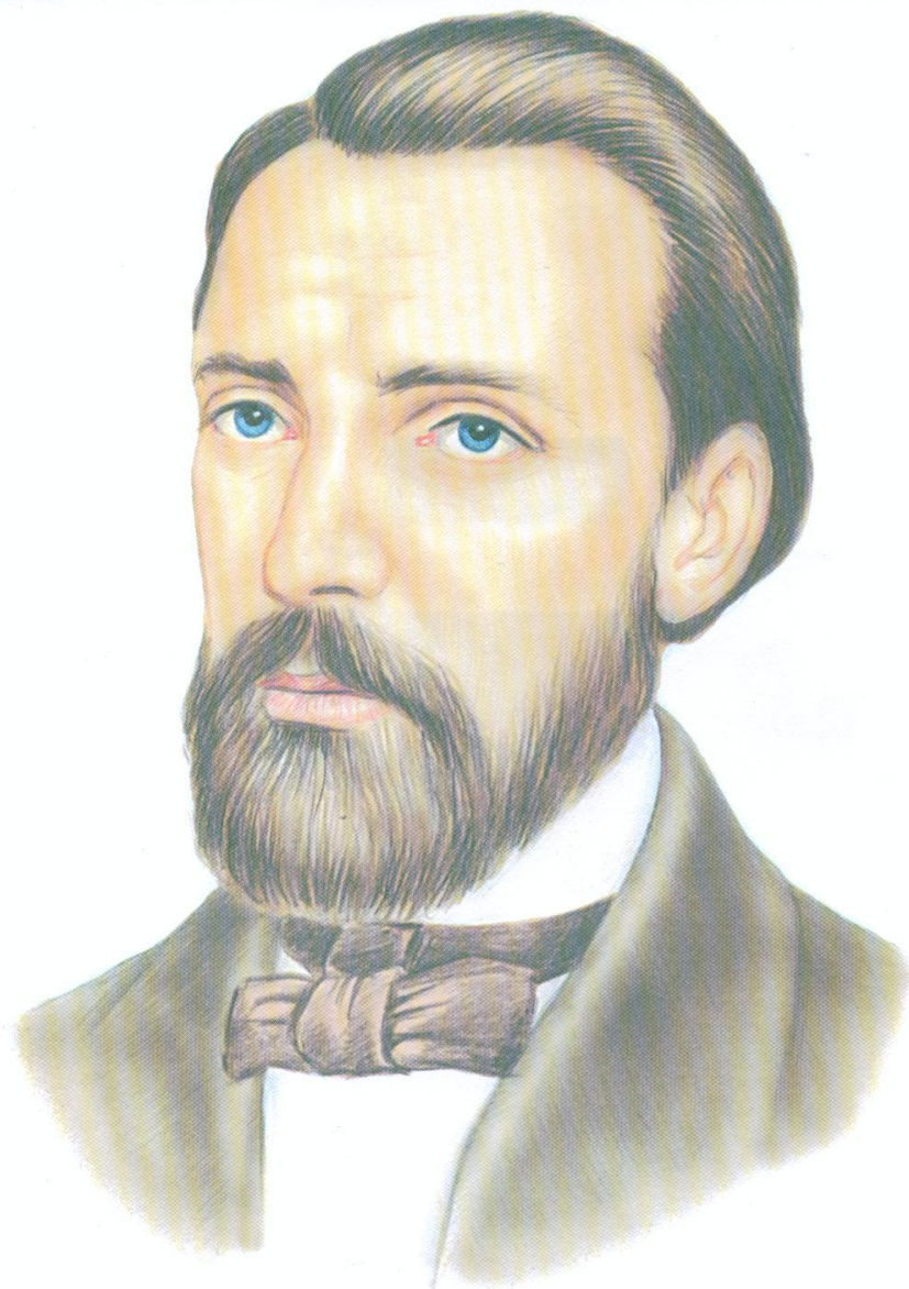
Никитин Иван Саввич (1824-1861)