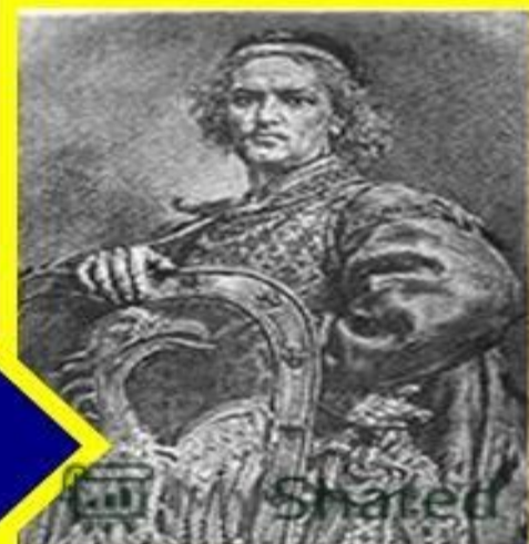
Польский князь Лешек Белый