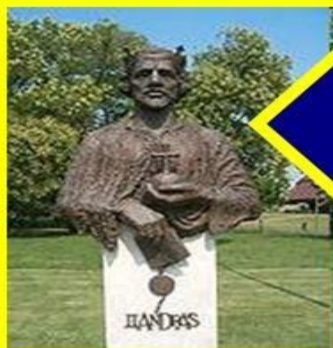
Венгерский король Андраш II

Вскоре в Галицию и Волыно вторглись поляки и венгры