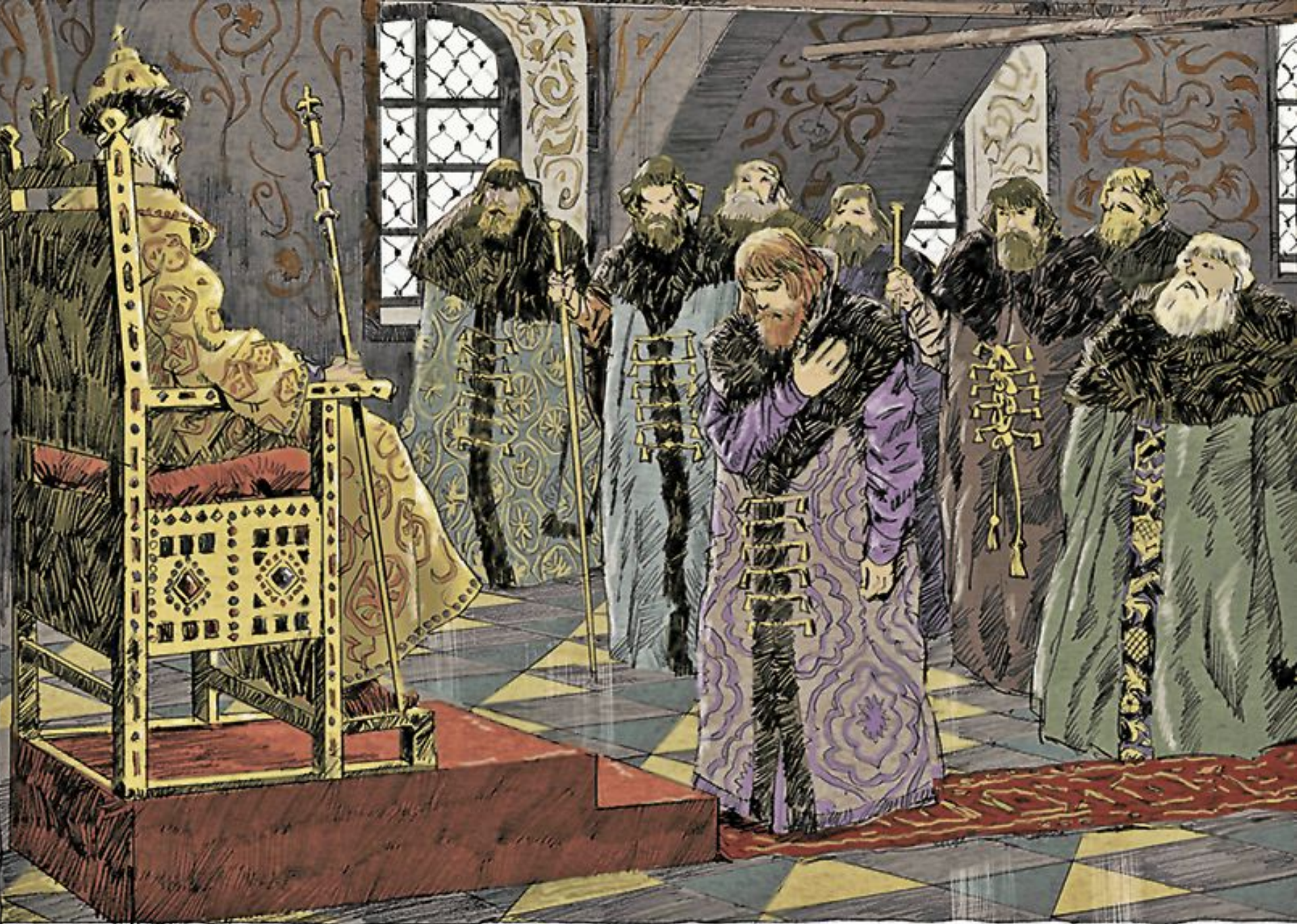
Заседание Боярской думы в конце правления