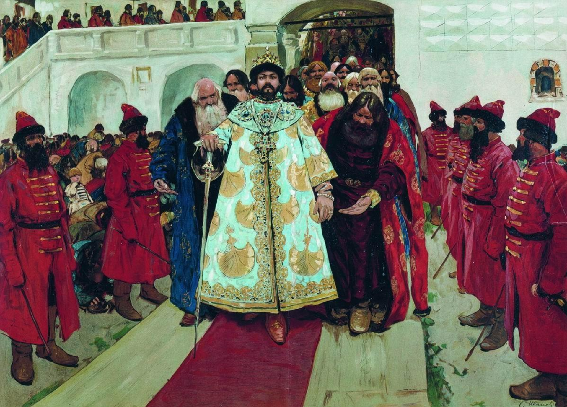
Великий государь, царь и самодержец всея Руси. С. В.