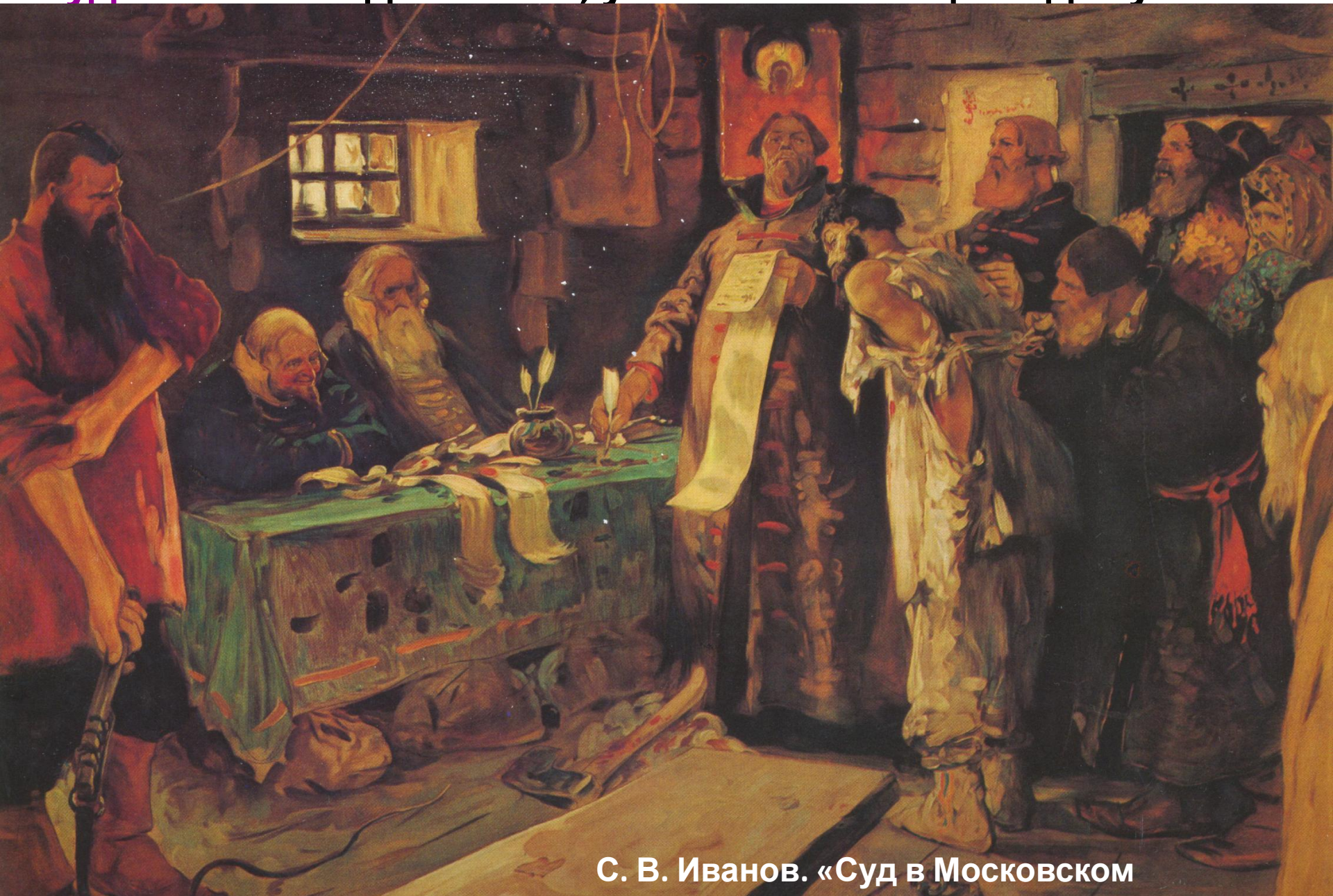
С. В. Иванов. «Суд в Московском»

В 1497 г. Появился первый общий для всей страны Судебник – свод законов, устанавливающий единую