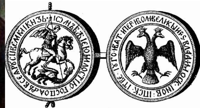
Печать Ивана III