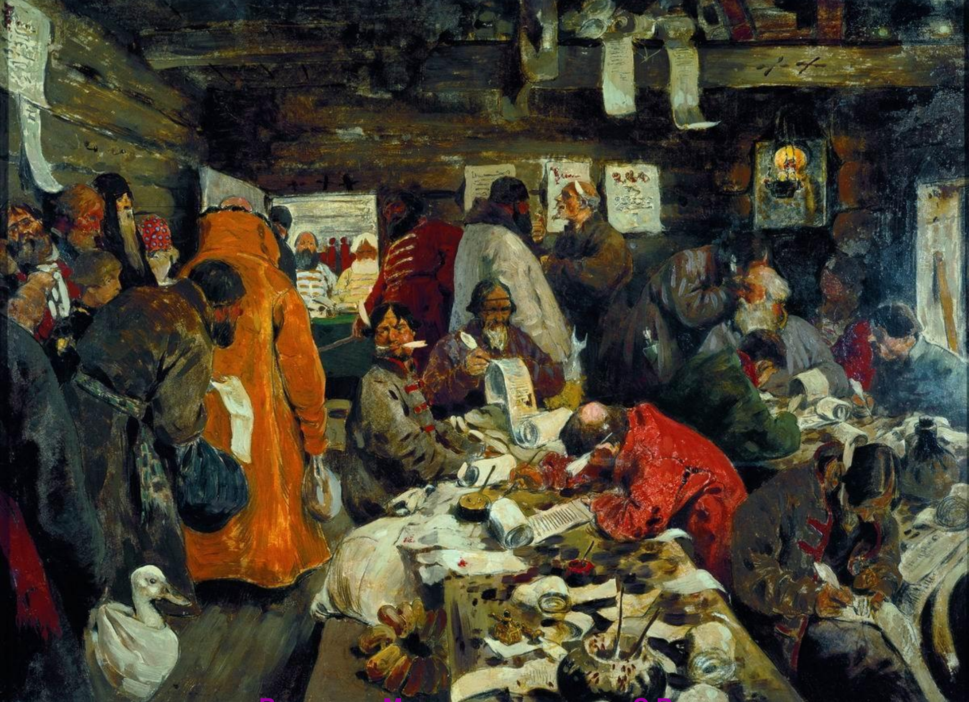
В приказе Московских времен. С.В.