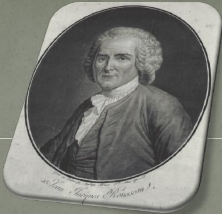
• Жан-Жак Руссо