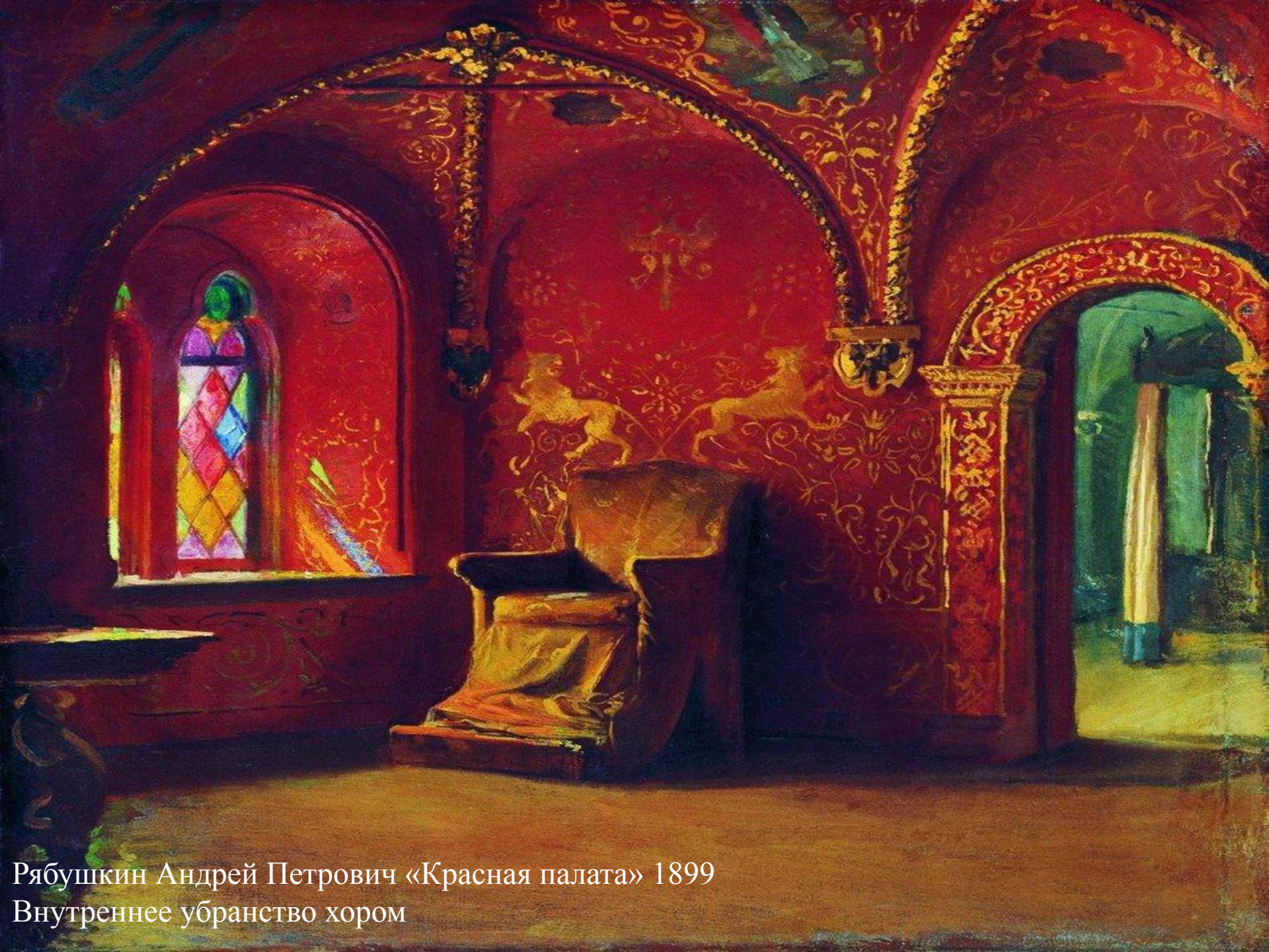
Рябушкин Андрей Петрович «Красная палата» 1899 Внутреннее убранство хором