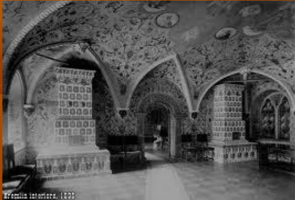
Sremski Dvorac, 1898