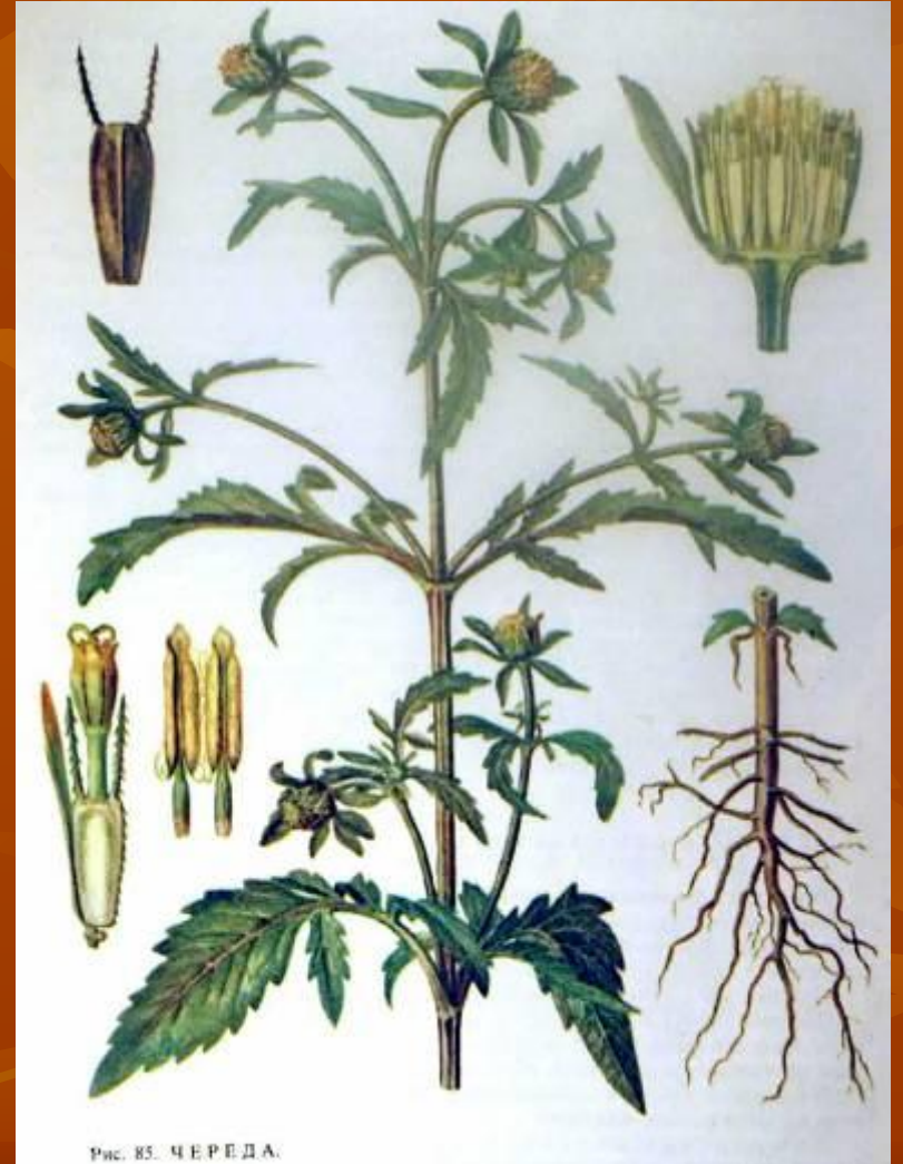
Рис. 85. ЧЕРЕДА.