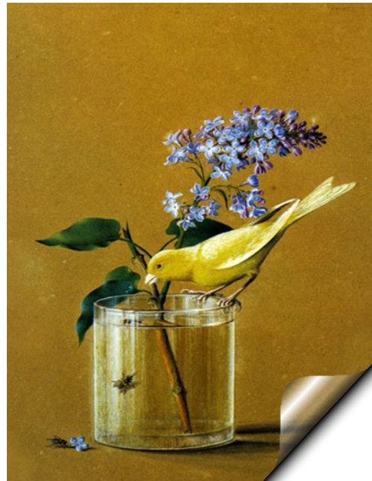
Ветка сирени и канарейка