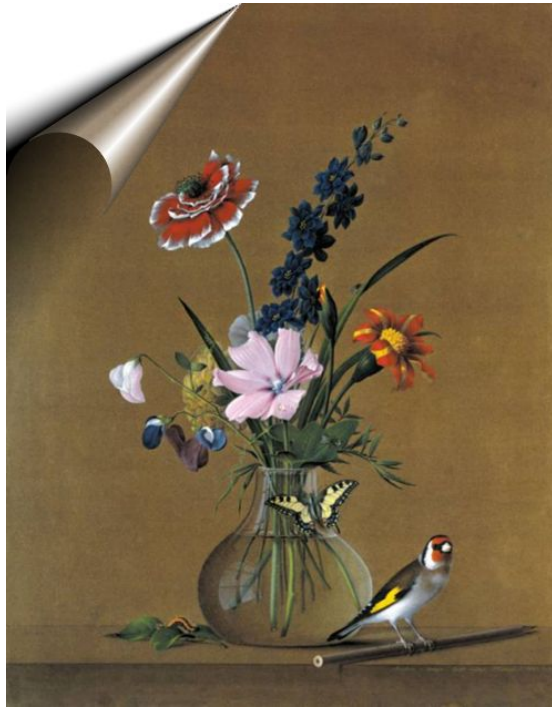
Букет цветов, бабочка и птичка