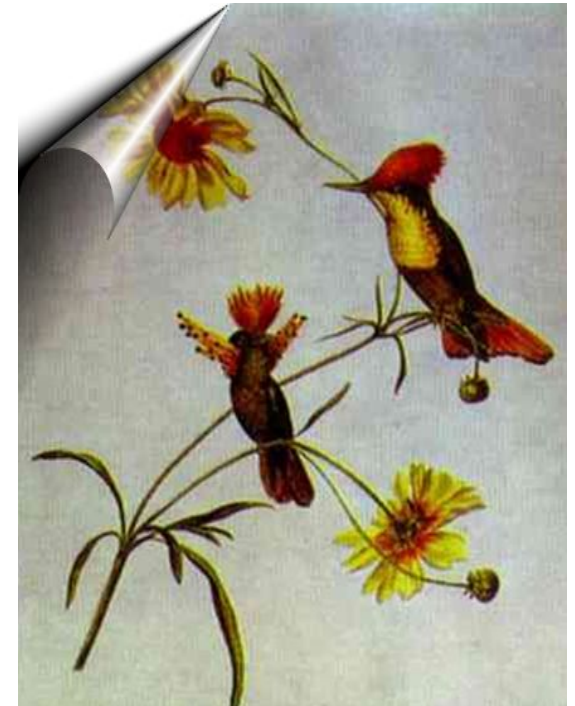
Птицы и цветы