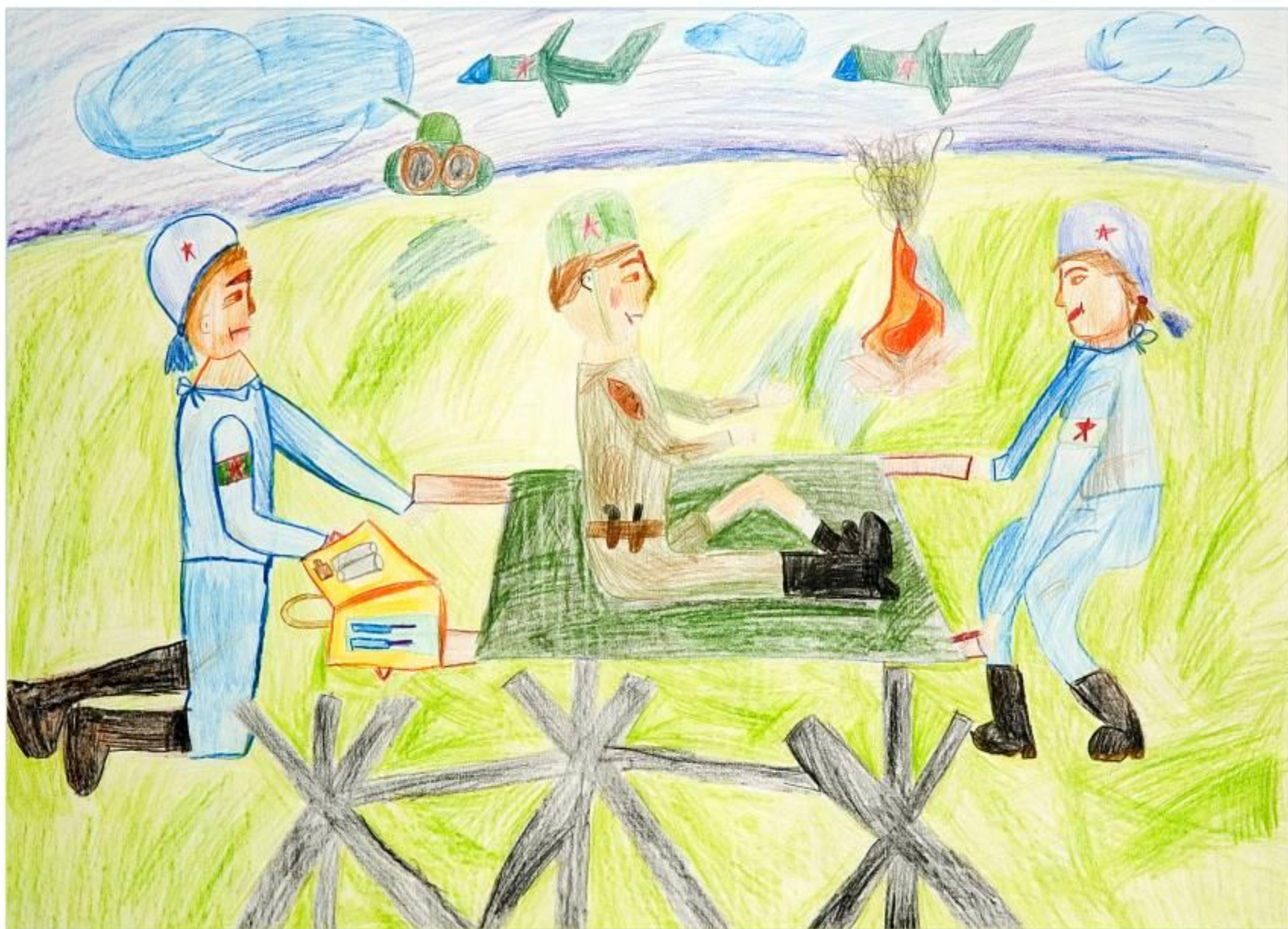
„ Санитары на передовой ”