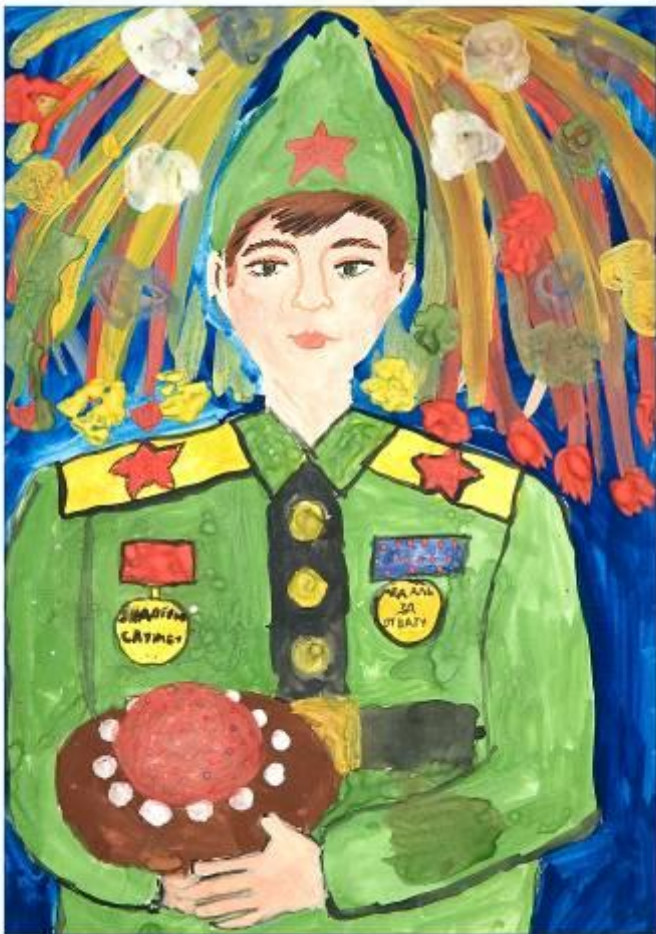
«Хлеб-соль побратимо» (гуашь) Выполнил: Иван Д. 12 лет МУ «Иркутская область художественный музей» №1 Возрастная группа: Дети Республика: Камчатка