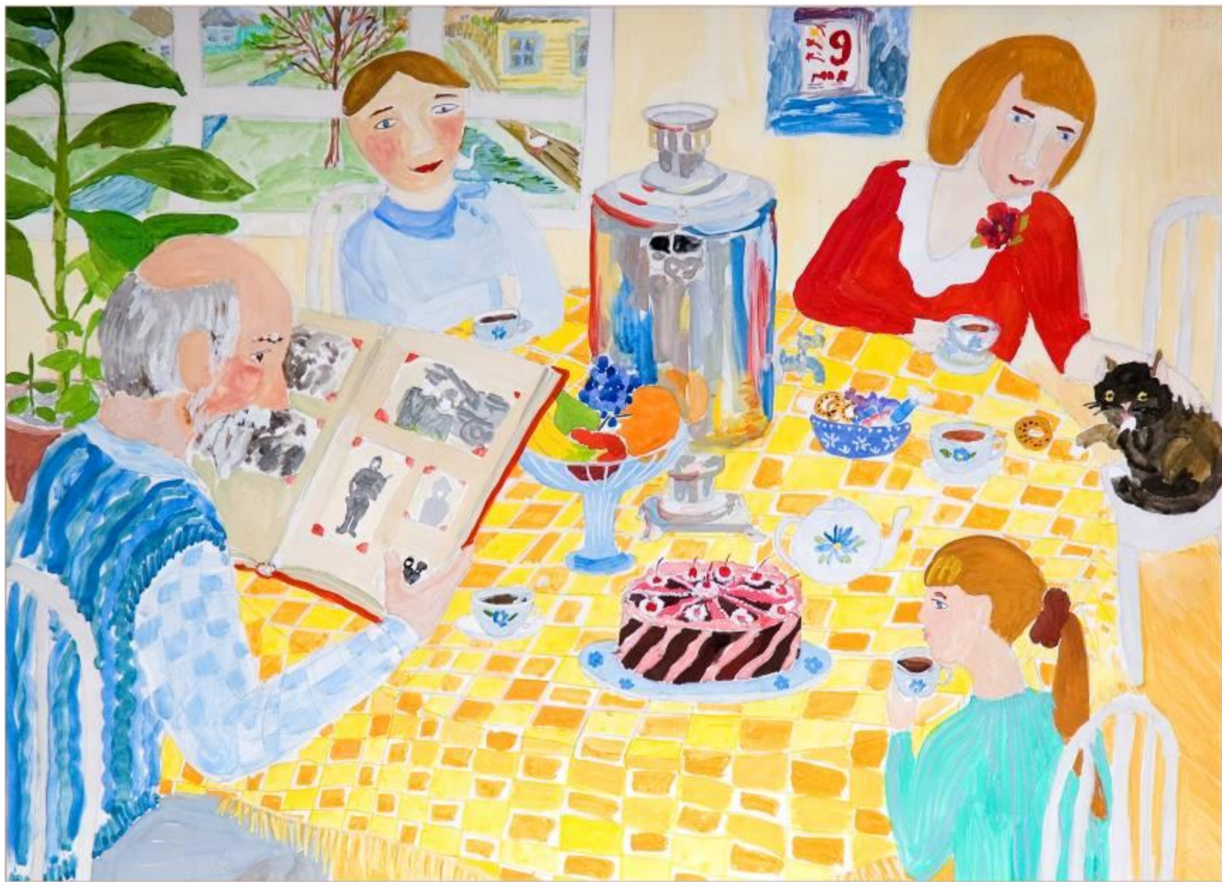
„ День Победы ” Мельдер Ксения, 13 лет ДШИ п.Козулька