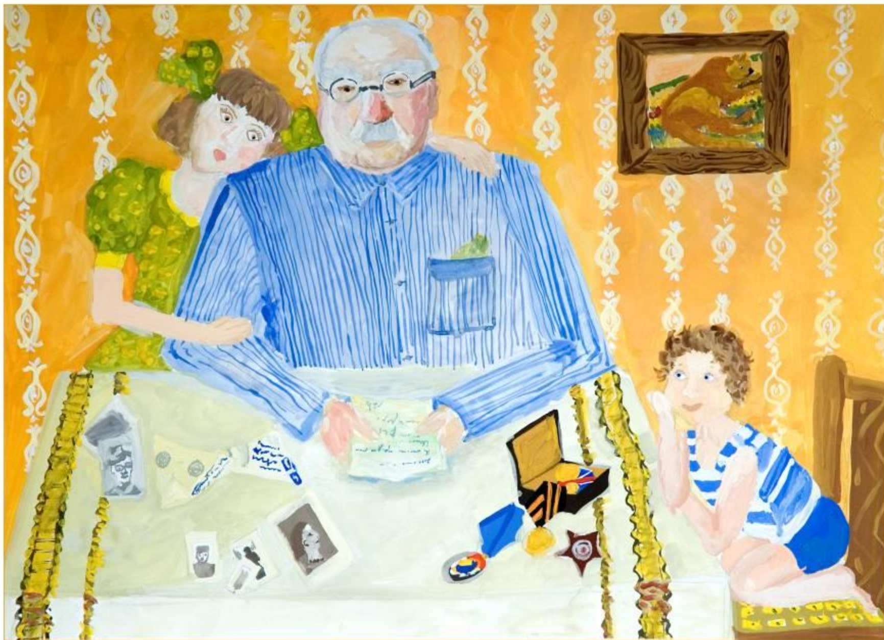
„ Дедушкино богатство ”