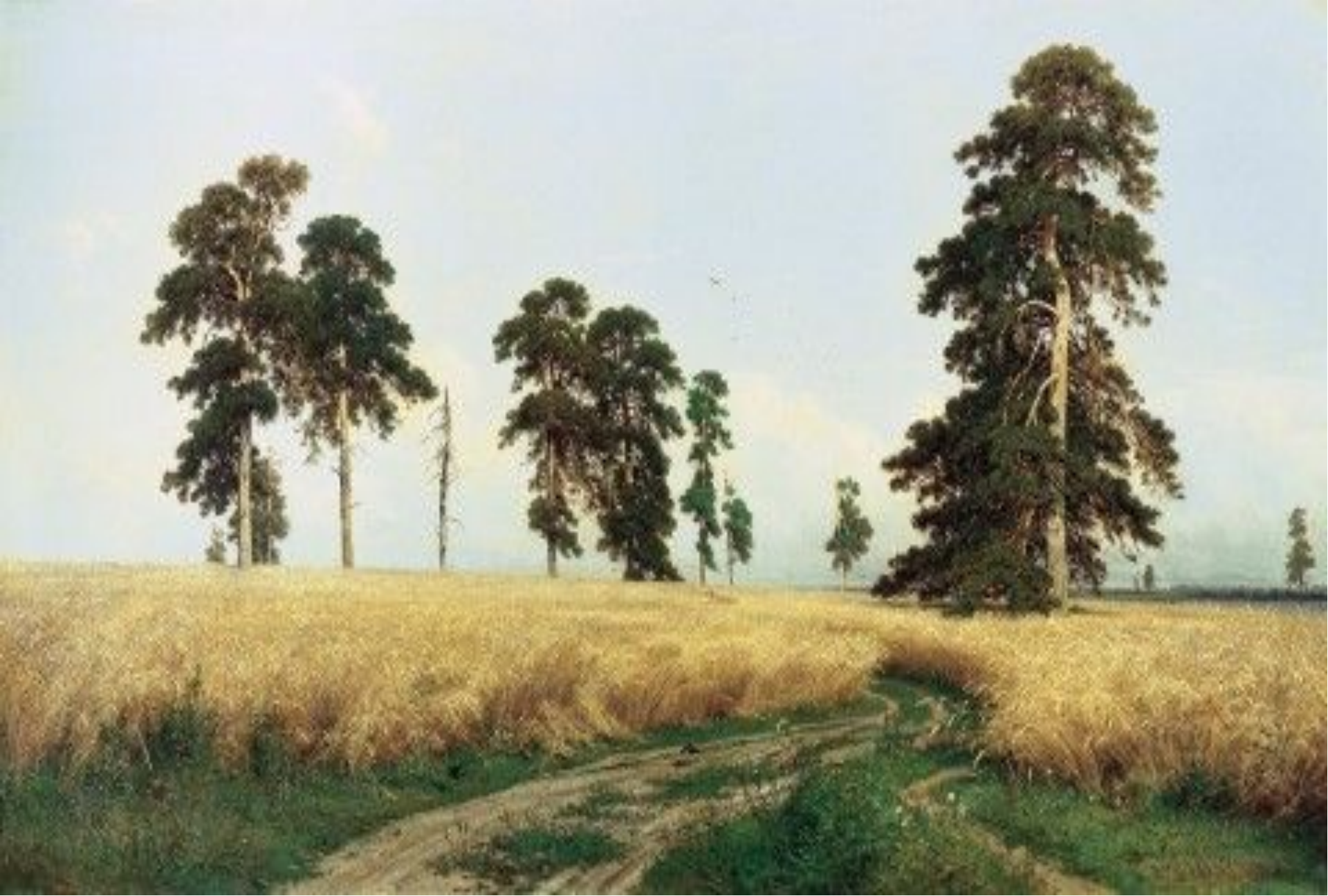
Иван Шишкин. Картина «Рожь»