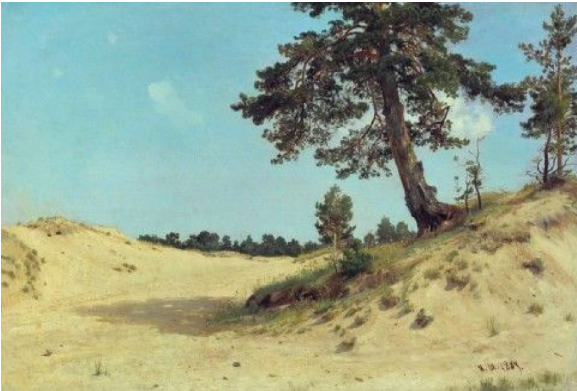
И.И. Шишкин. Сосна на песке.