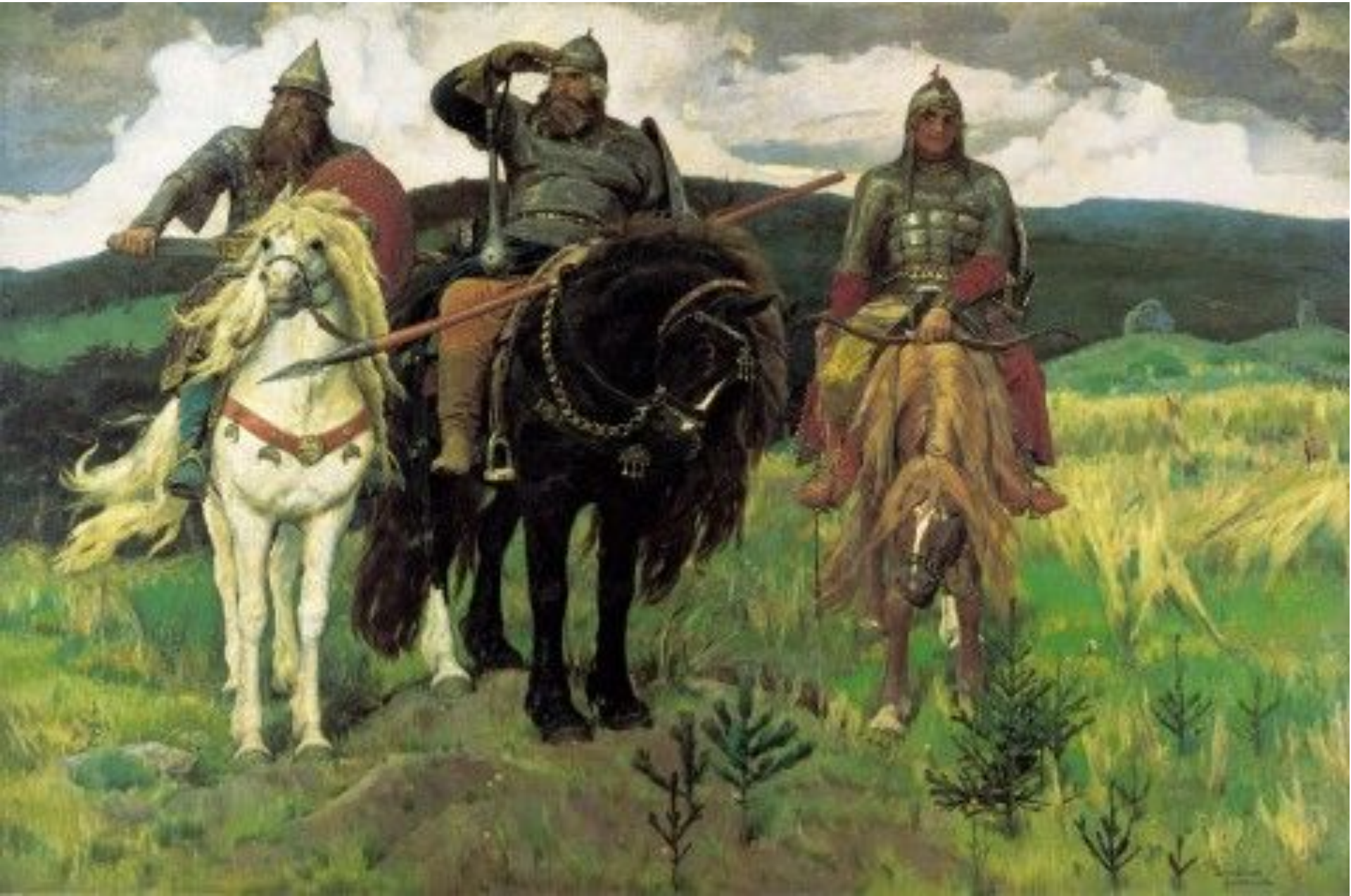
«Богатыри» Виктор Васнецов.