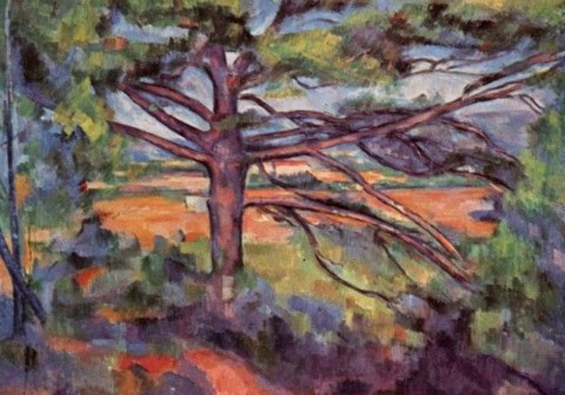
Поля Сезанна «Большая сосна на фоне красных полей»