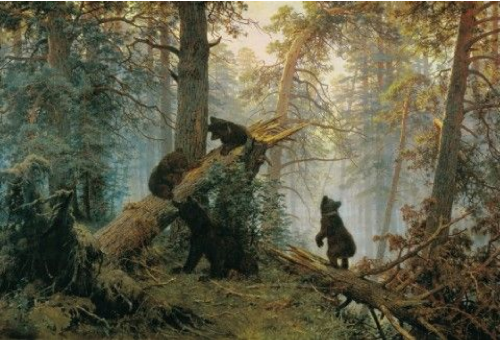
«Утро в сосновом лесу» Ивана Шишкина,