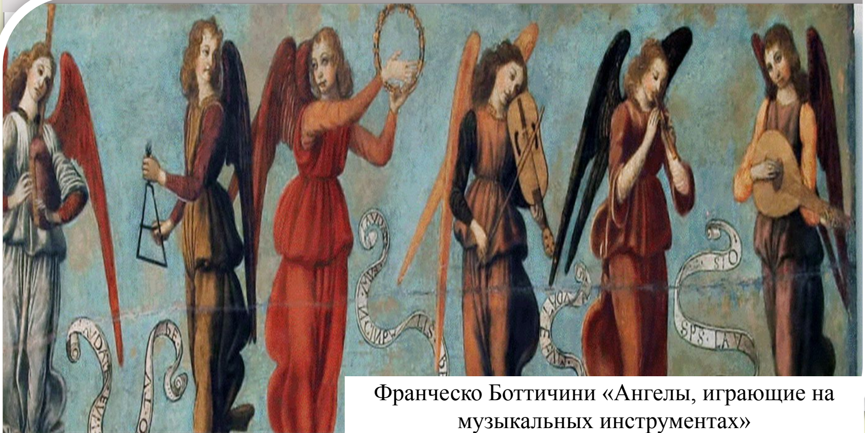
Франческо Боттичини «Ангелы, играющие на музыкальных инструментах»

Часто художники и скульпторы в своих произведениях изображают музыкантов и музыкальные инструменты, запечатлевают процесс игры и слушания музыки на своих полотнах.