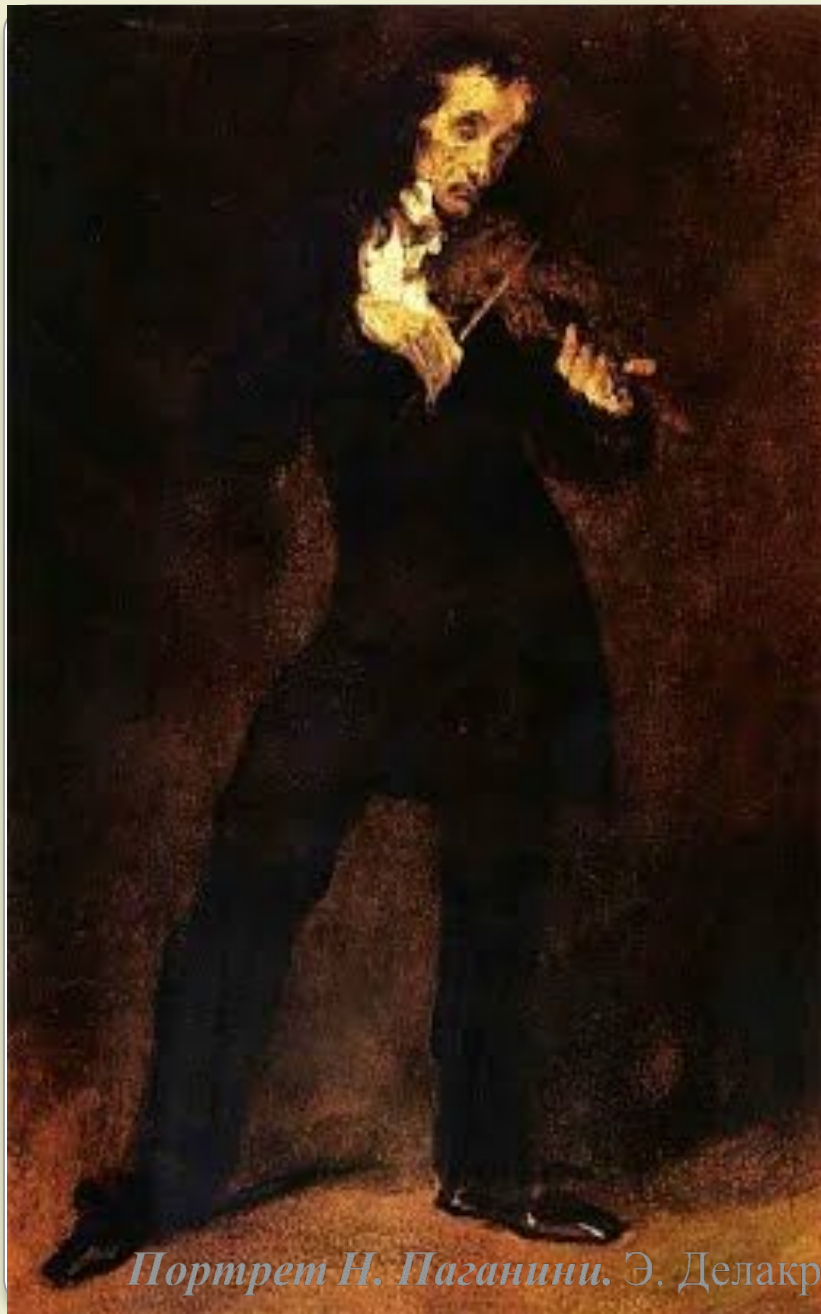
Портрет Н. Паганини. Э. Делакруа.

Никколо Паганини (1782-1840) – имя этого итальянского композитора и скрипача-виртуоза XIX в. известно всему миру. Его мастерство на скрипке было настолько совершенно и неподражаемо, что ходили слухи, будто исполнять труднейшие пассажи своих произведений ему помогает нечистая сила. Не случайно, одна из пьес Паганини получила название «Дьявольские трели».