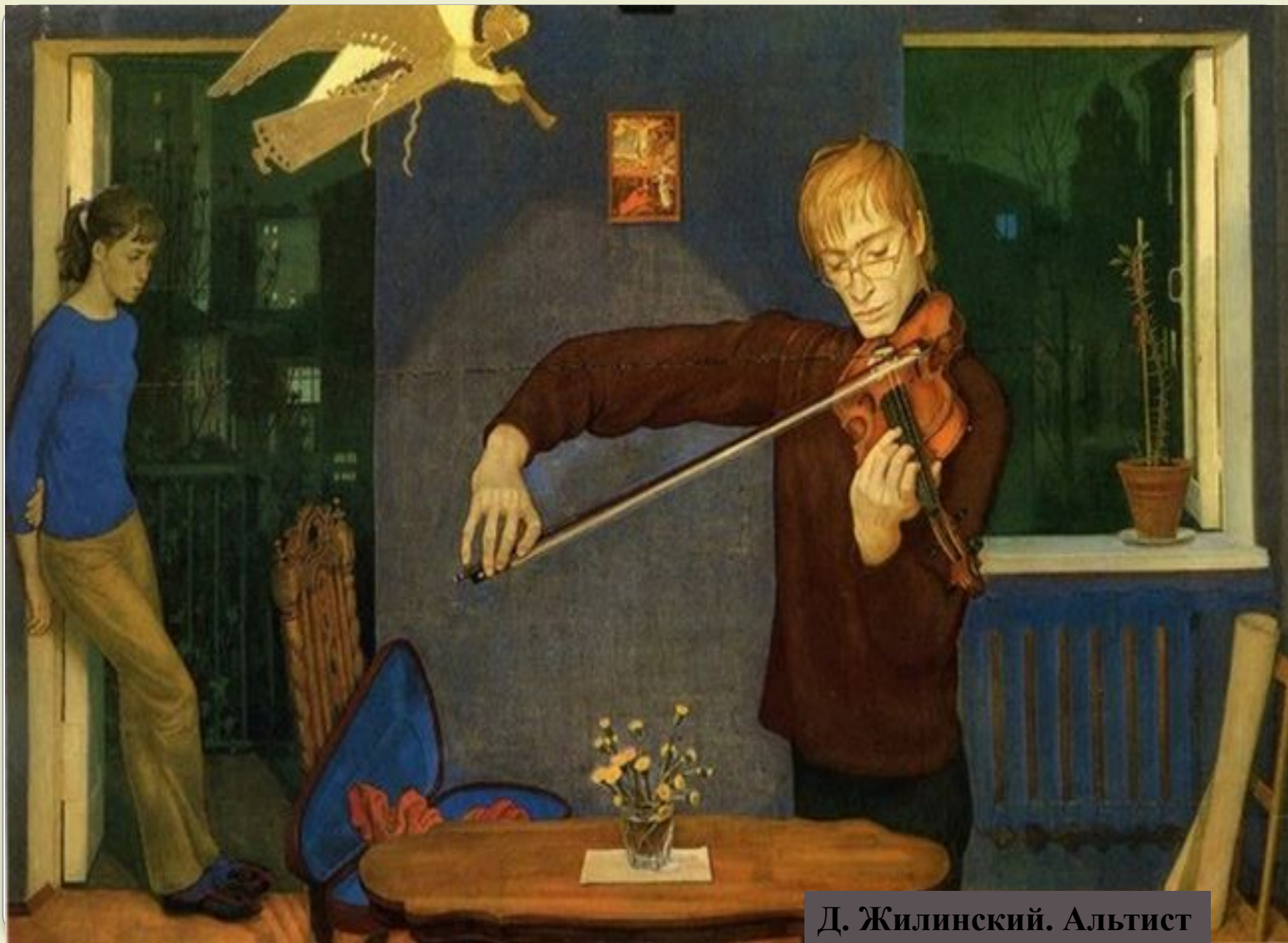
Д. Жилинский. Альтист