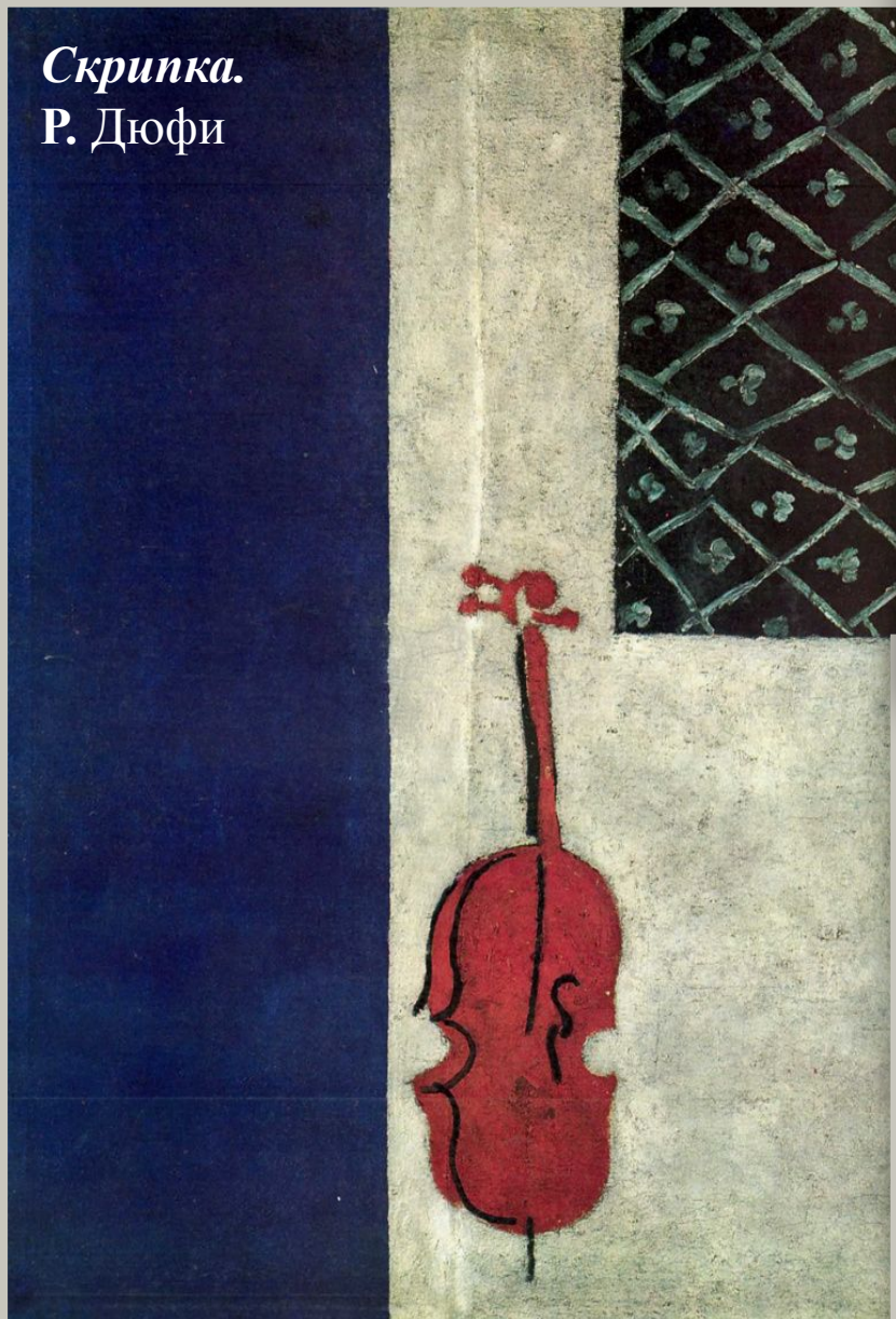
Скрипка. Р. Дюфи