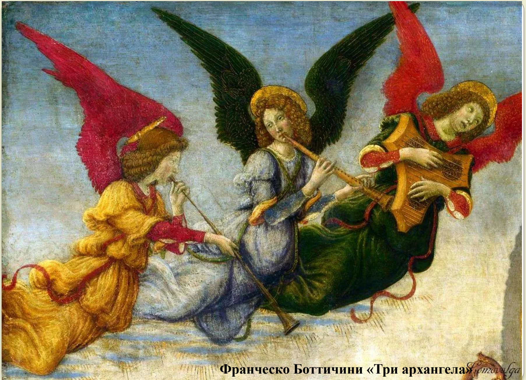
Франческо Боттичини «Три архангела» Sandro Botticelli