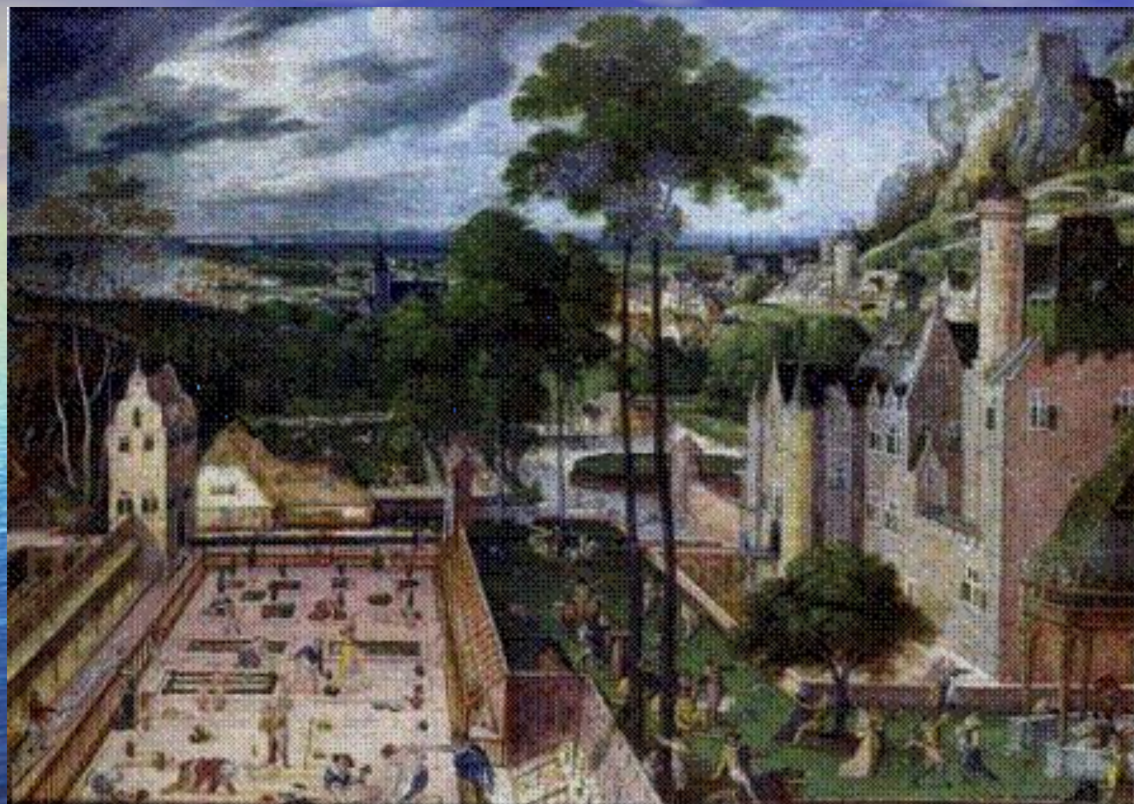
Замковый сад весной. Ганс Бол, 1586 г