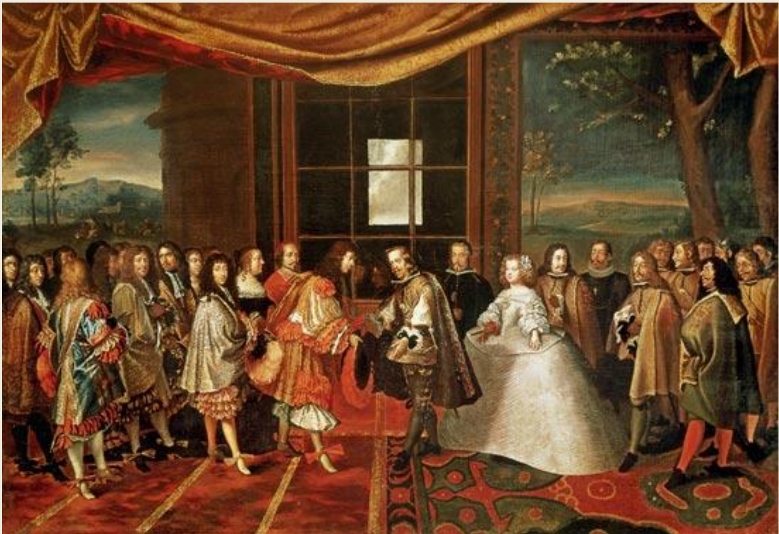
Встреча Людовика XIV с Филиппом IV.

Французские аристократы подражали своему правителю.