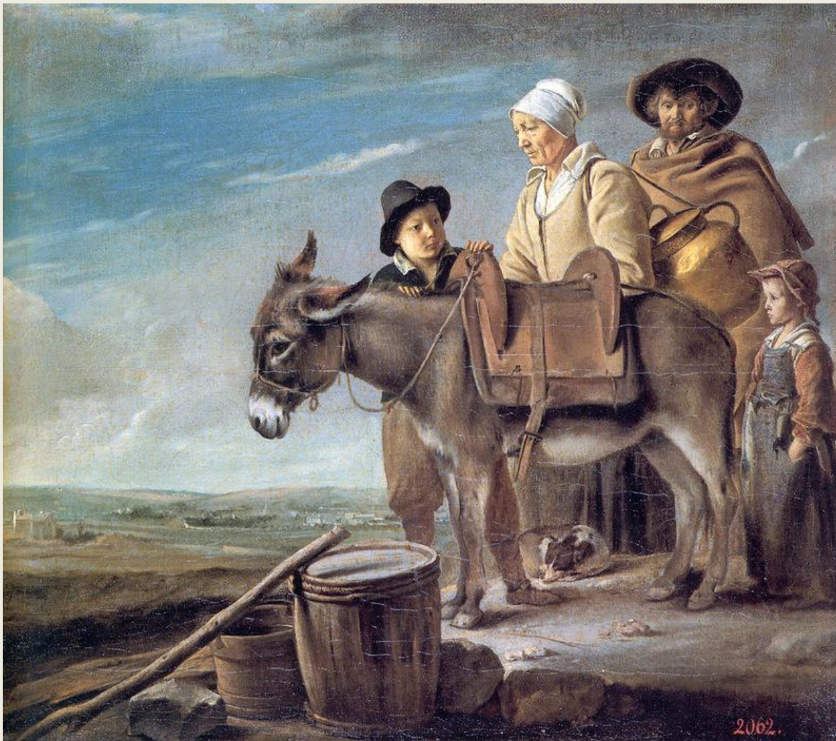
Луи Ленен. Семейство молочницы. 40е гг. XVII в