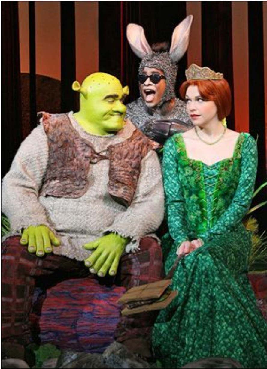
Shrek The Musical Broadway Theatre New York.