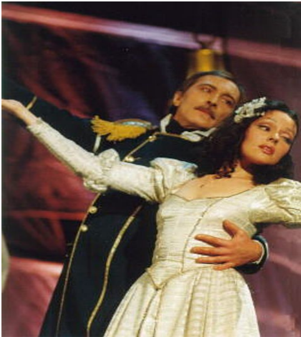
Постановка "Юнона и Авось".