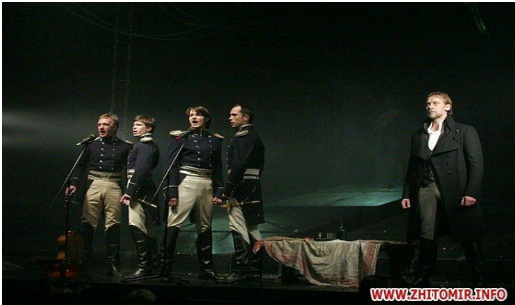
Юнона и Авось" - кадры из мюзикла.