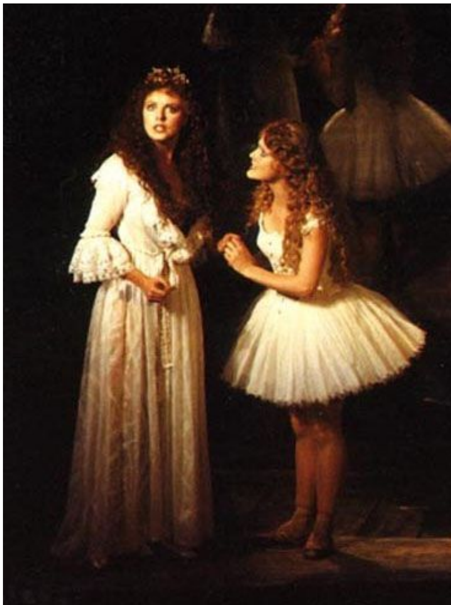
Мюзикл "Призрак Оперы"