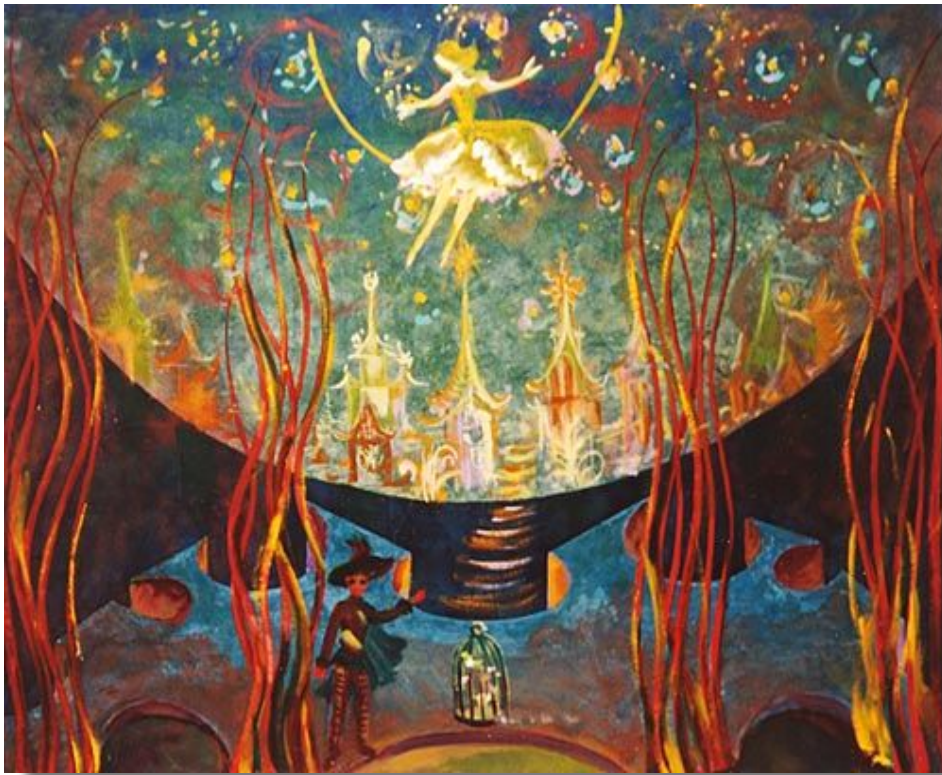
Эскиз декораций к опере «Волшебная флейта»