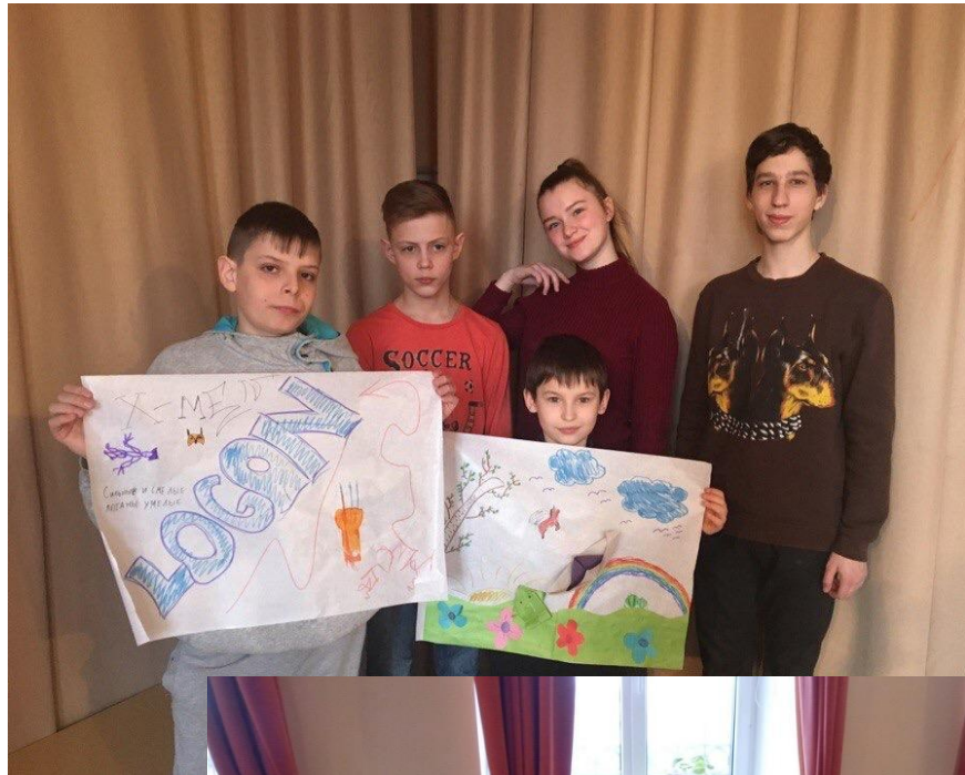
Фото отчет о проведении игровых мастер-классов