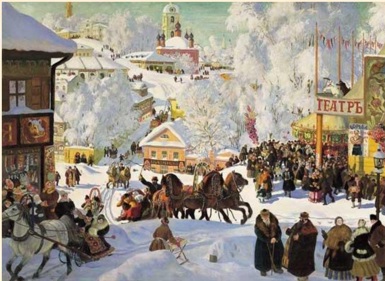
Борис Кустодиев "Масленица" (1919)