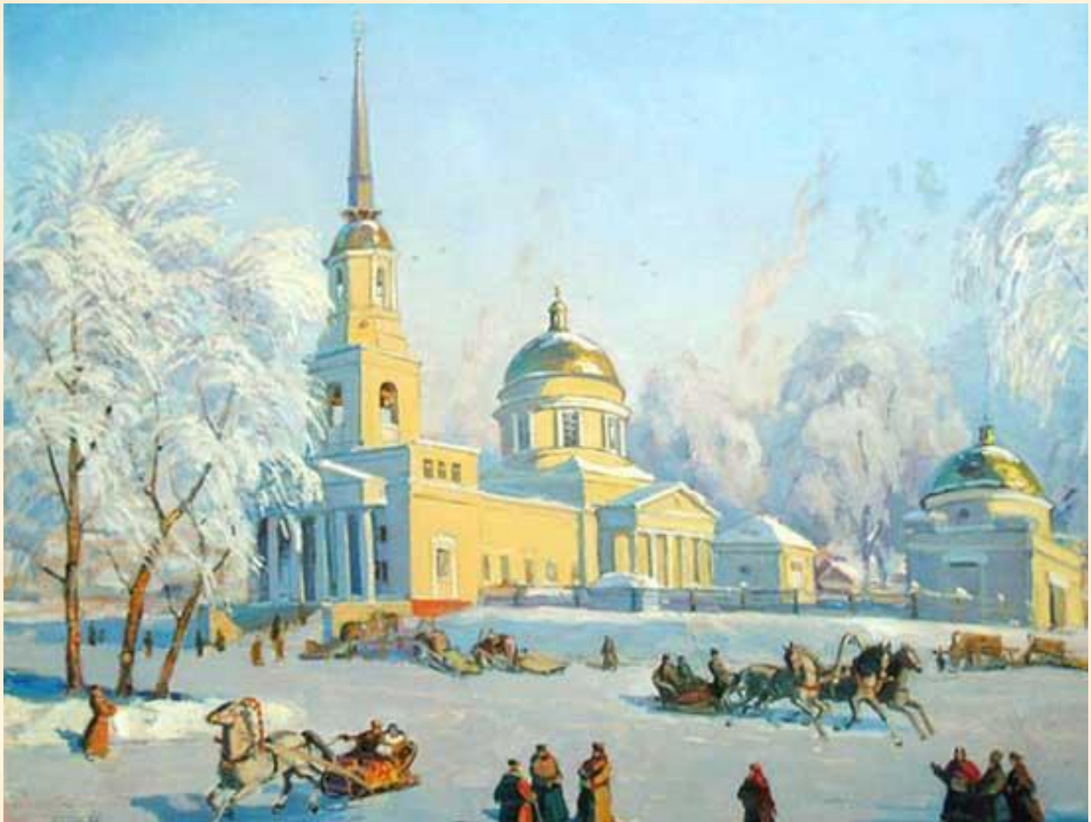
Валентин Белых "Собор Александра Невского. Масленица"