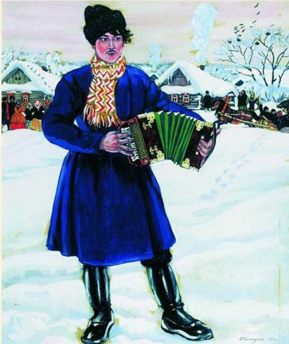
Борис Кустодиев "Деревенская масленица (Гармонист)" 1916 г.