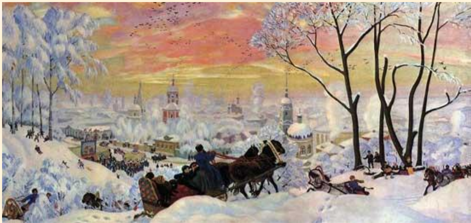
Борис Кустодиев "Масленица" 1916 г.