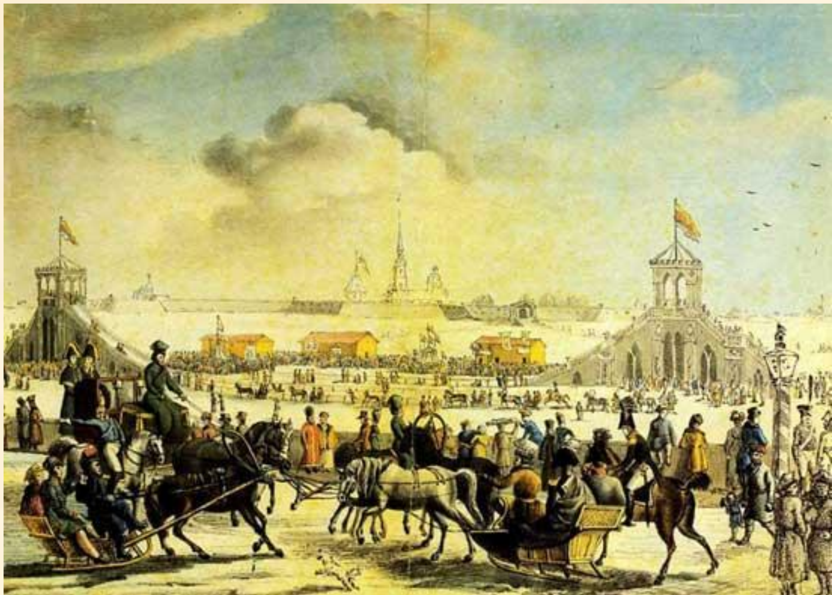
Н. Серракаприола "Катальные горы на большой Неве" 1817 г.