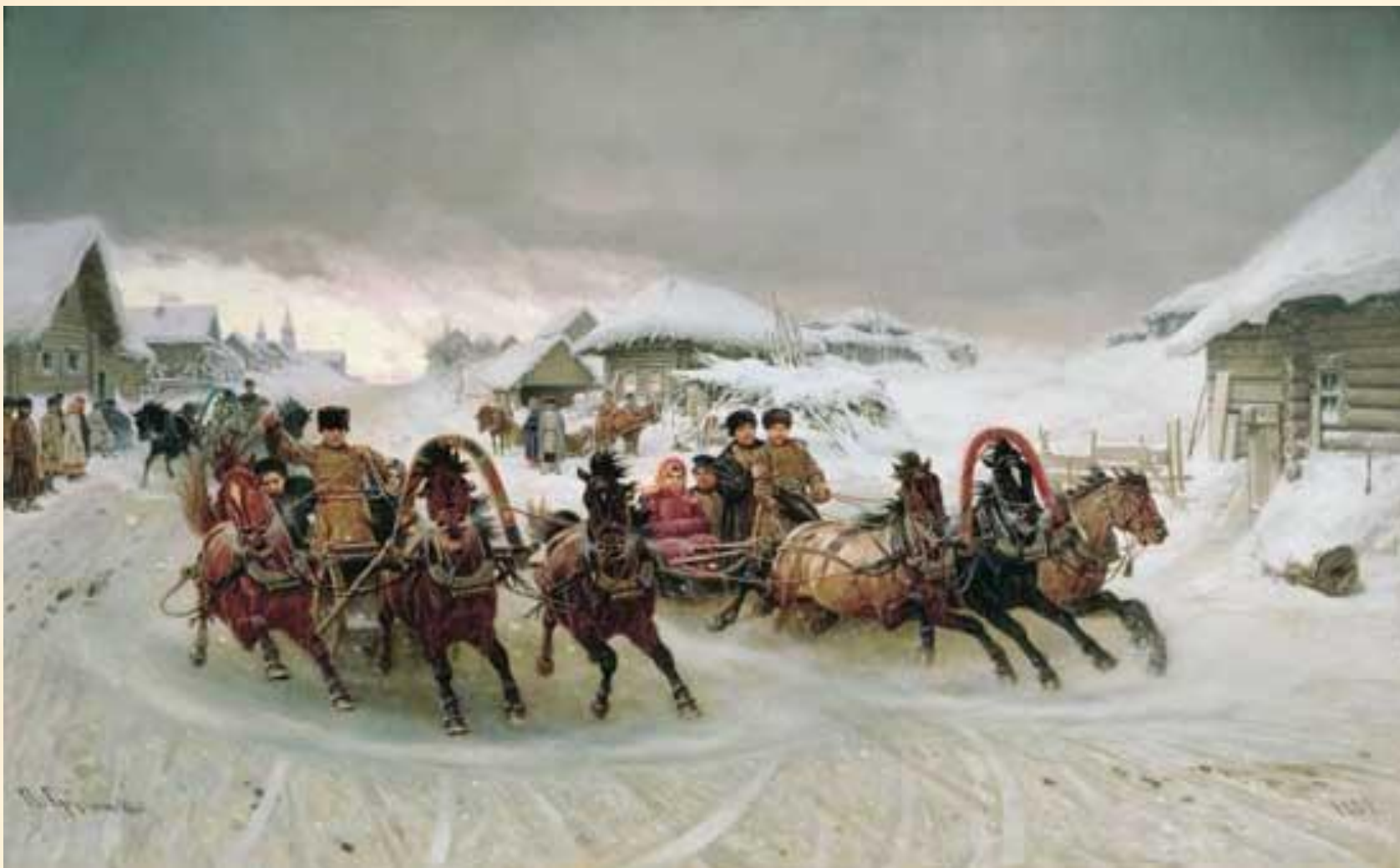
Петр Николаевич Грузинский "Масленица" 1889 г.