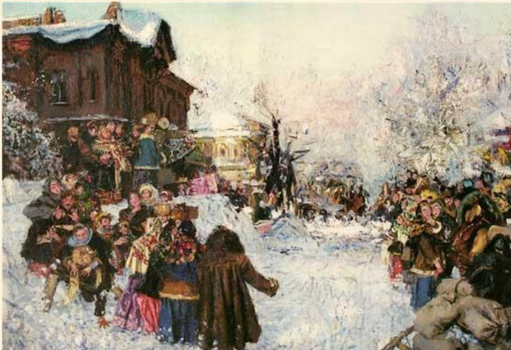
Знак А.М. "Проводы зимы в старом Красноярске" 1996 г.