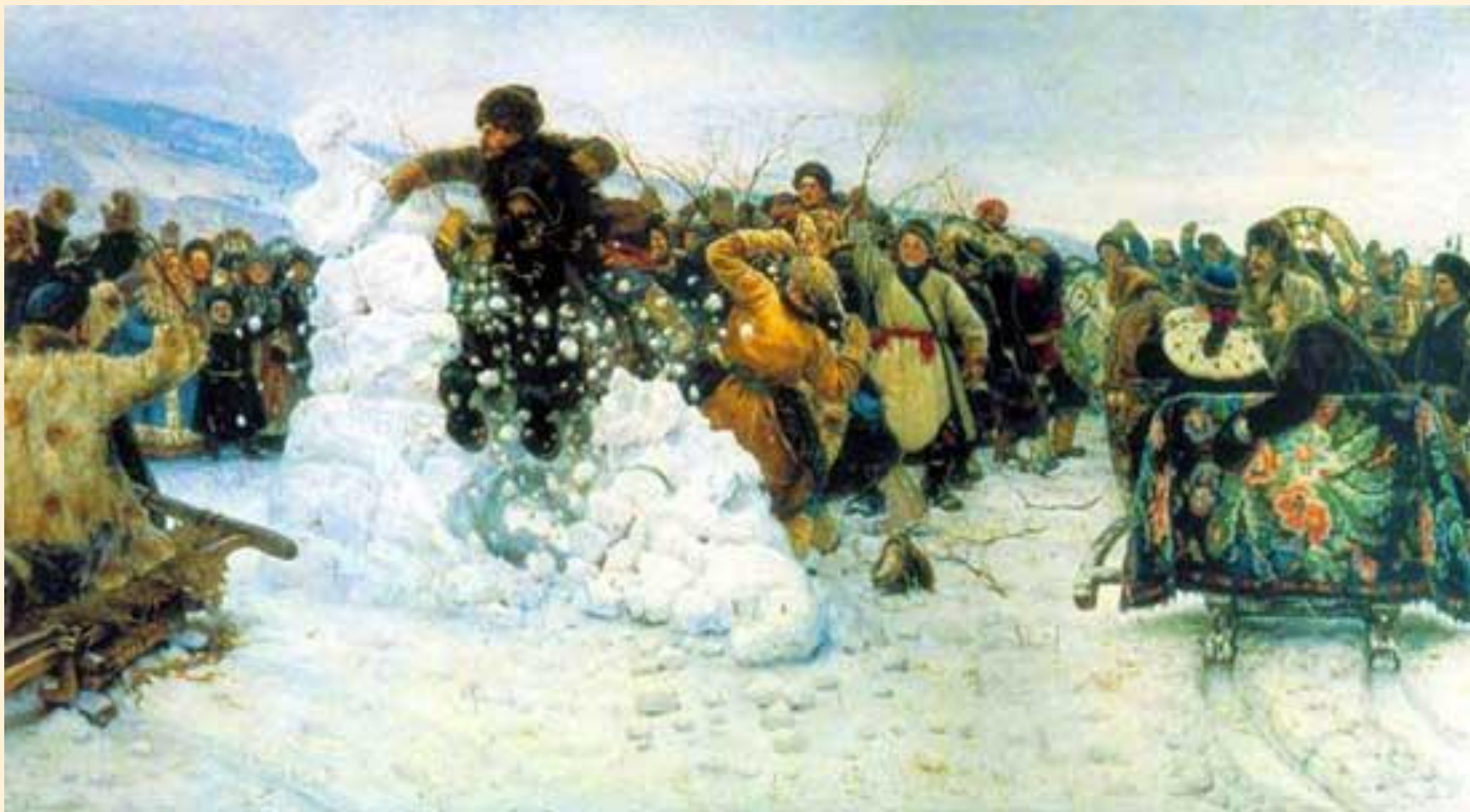
В.И Суриков "Взятие снежного города"