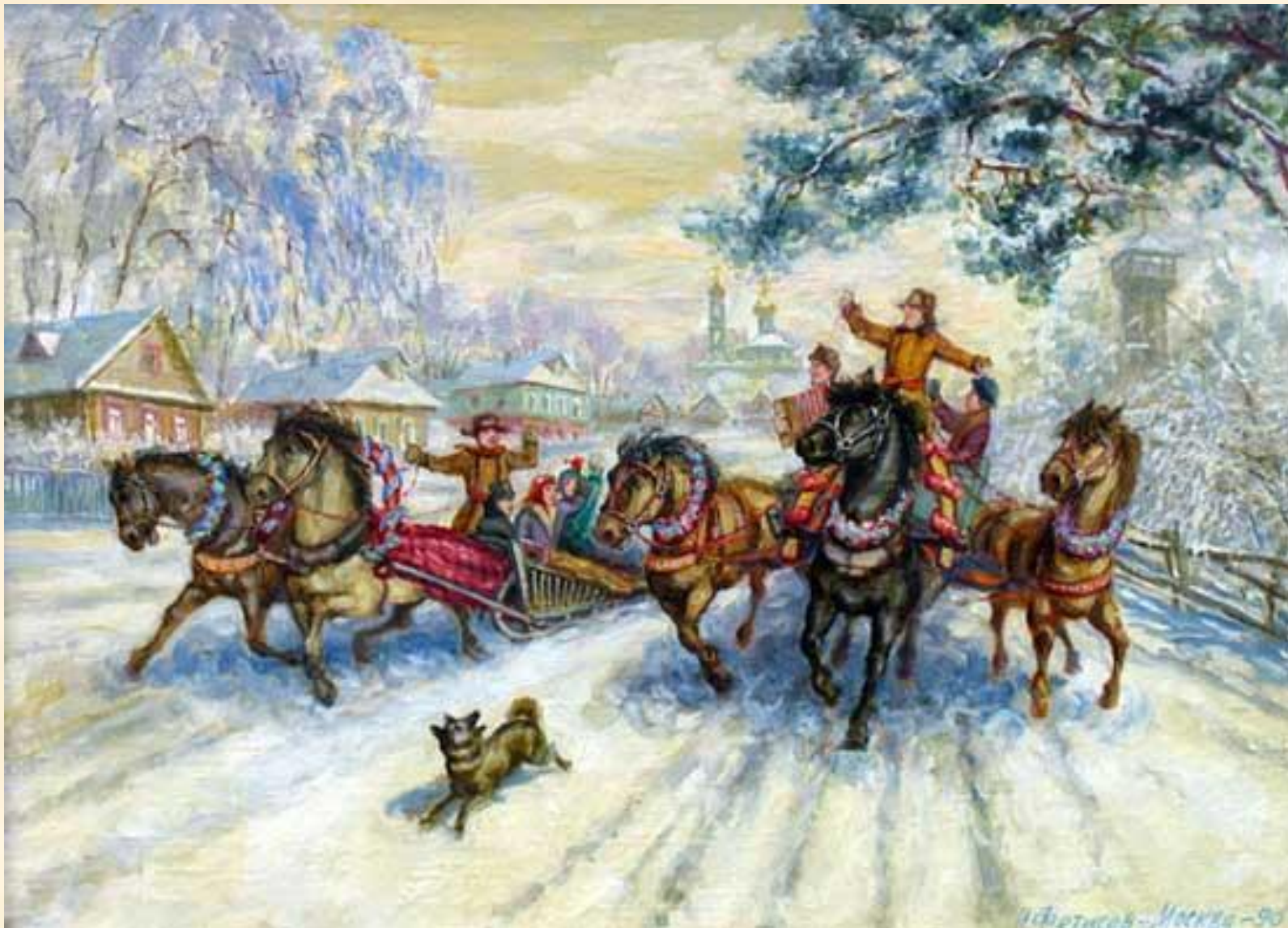
Н. Фетисов "Широкая Масленица" 1990 г.