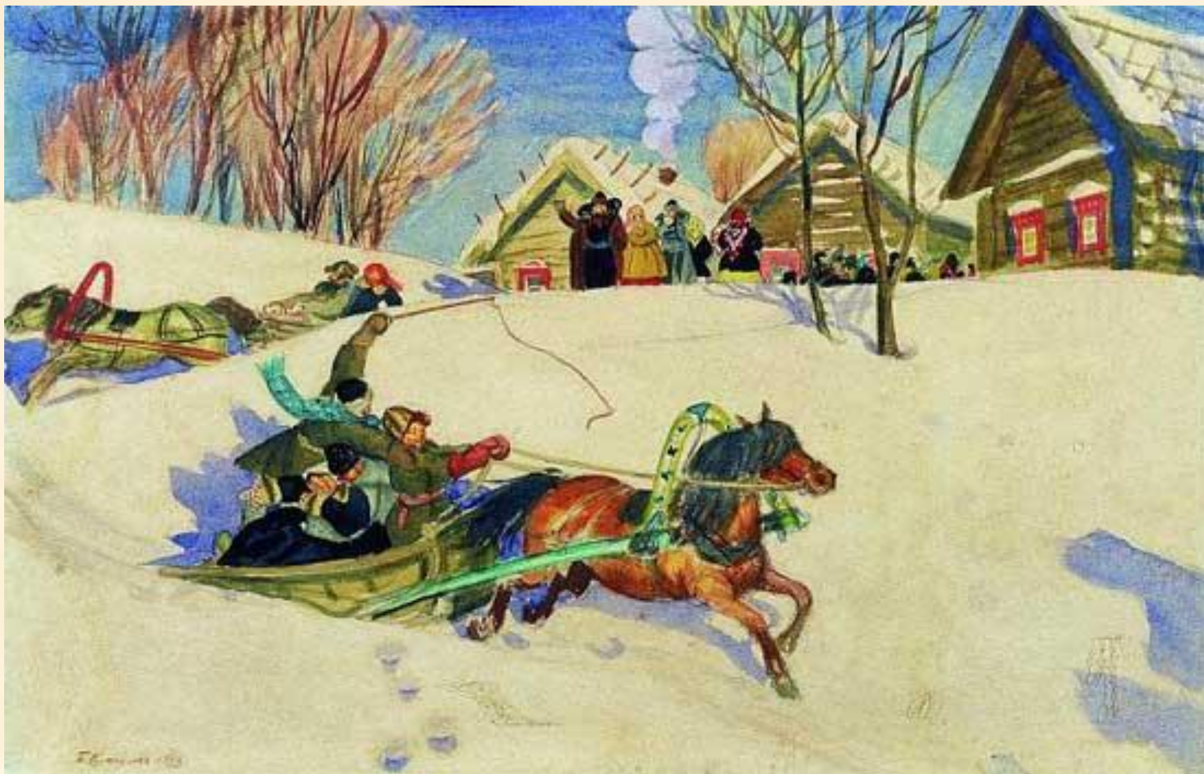
Борис Кустодиев "Масленица" 1920