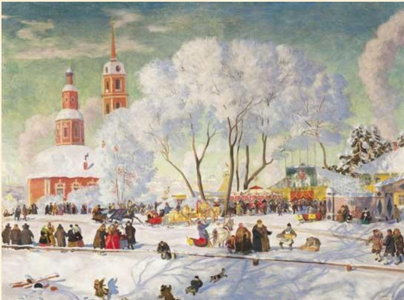
Борис Кустодиев "Масленица" 1920 г.