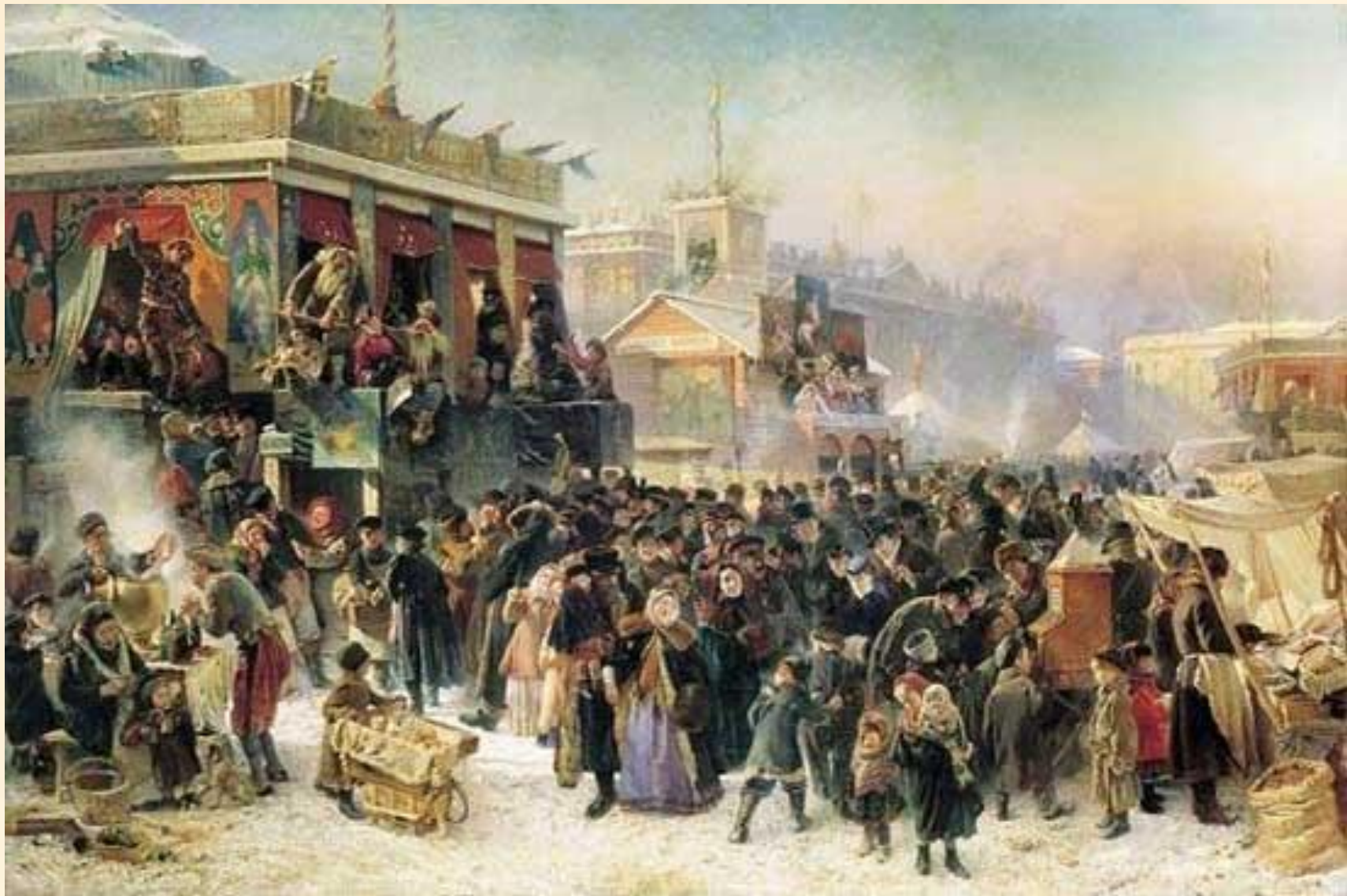
К. Е. Маковский "Народное гуляние во время Масленицы на Адмиралтейской площади в Петербурге" 1869 г.