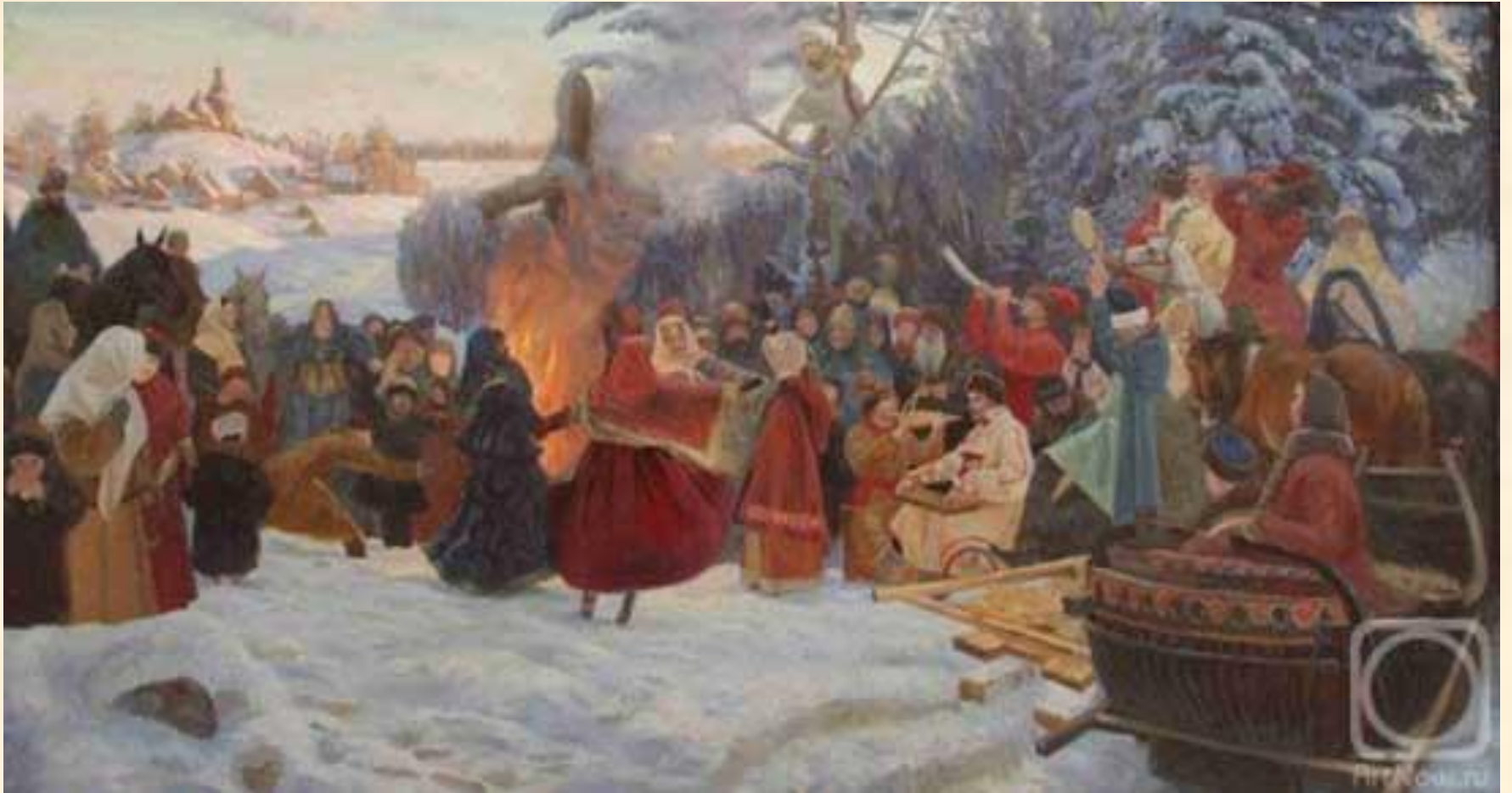
Семен Кожин "Масленица. Проводы." Россия 17 век