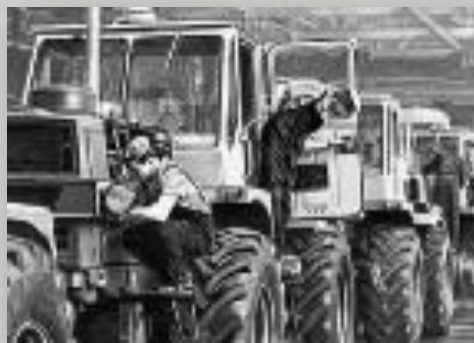
Челябинский тракторный завод