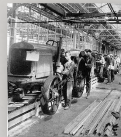
Сталинградский, Харьковский тракторные заводы