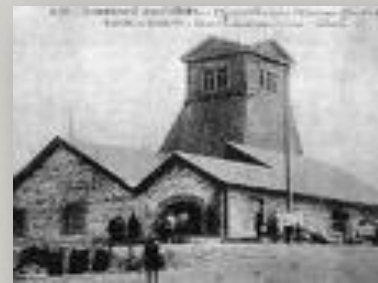
Шахты Донбаса и Кузбаса