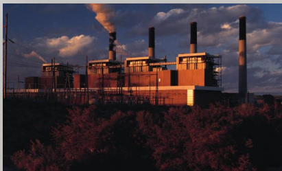
Магнитогорский, Кузнецкий металлургические комбинаты