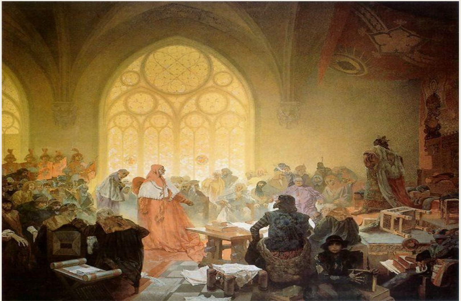
Просветительская деятельность св. Кирилла и Мефодия.