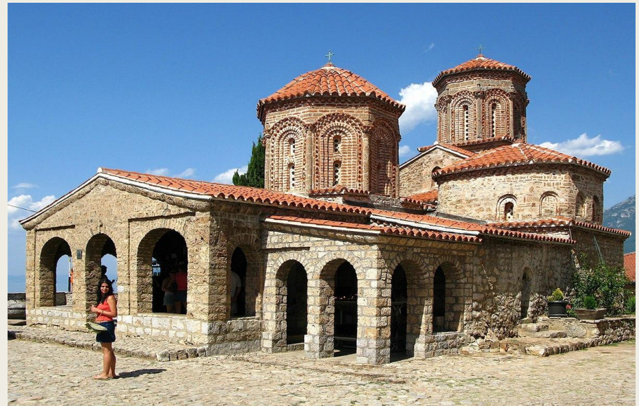
Преславская литературная школа