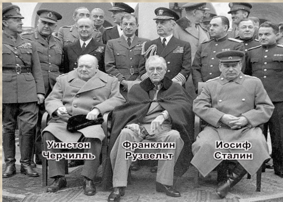
Февраль 1945 г. Крымская (Ялтинская) конференция