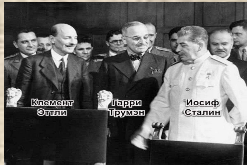
Июль-август 1945 г. Потсдамская конференция

Обсуждение: Какими были особенности Ялтинско-Потсдамской системы?