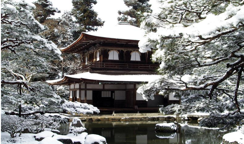
Гинкаку-Дзи (серебряный павильон)