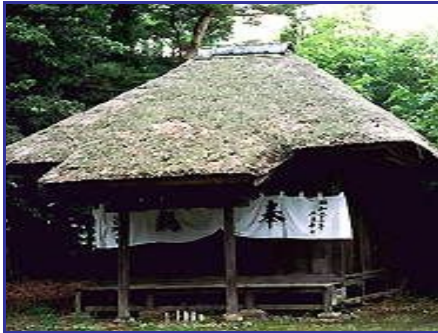
Минка — «дом простолюдина», дерево, бумага.