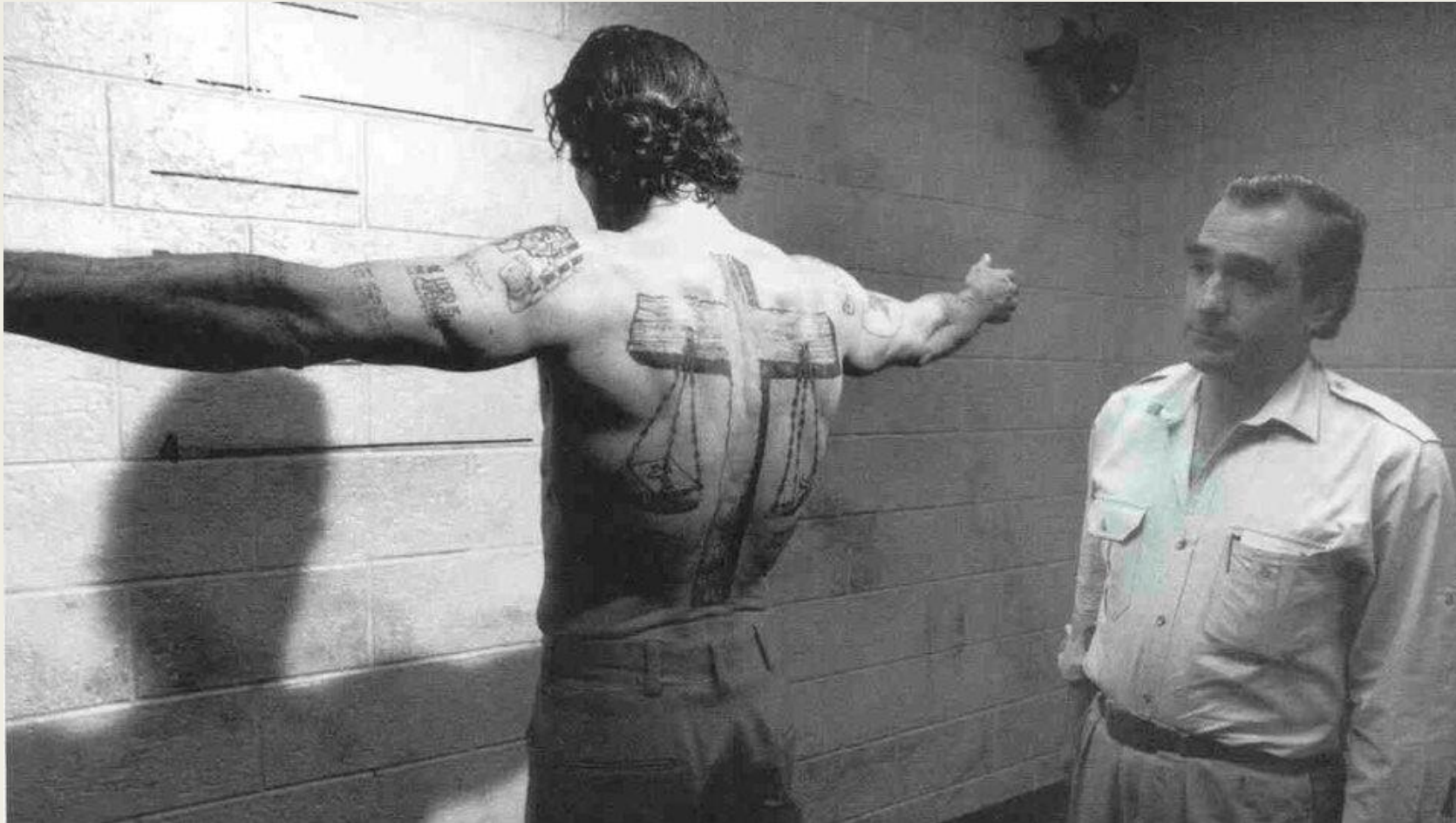
На съемках фильма «Мыс страха»