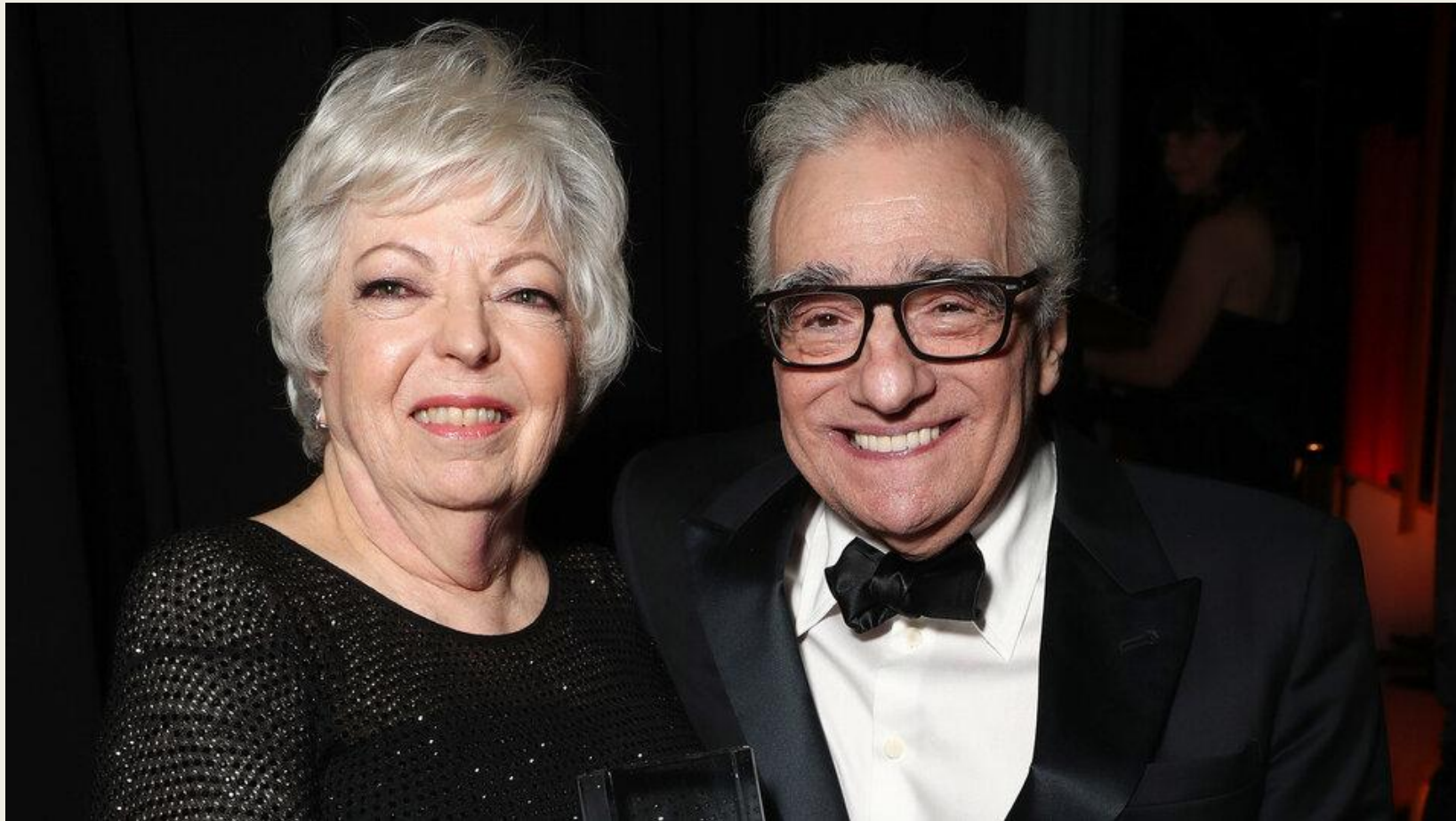
Тельма Скунмейкер и Мартин Скорсезе