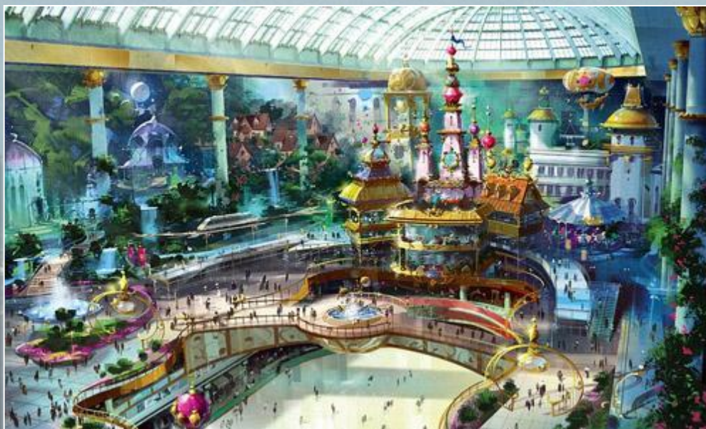
Парк развлечений Lotte World