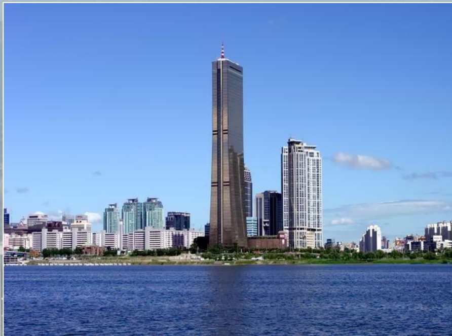
Небоскреб «б3», Юксам Билдинг

Из достопримечательностей этого города можно выделить две смотровые площадки