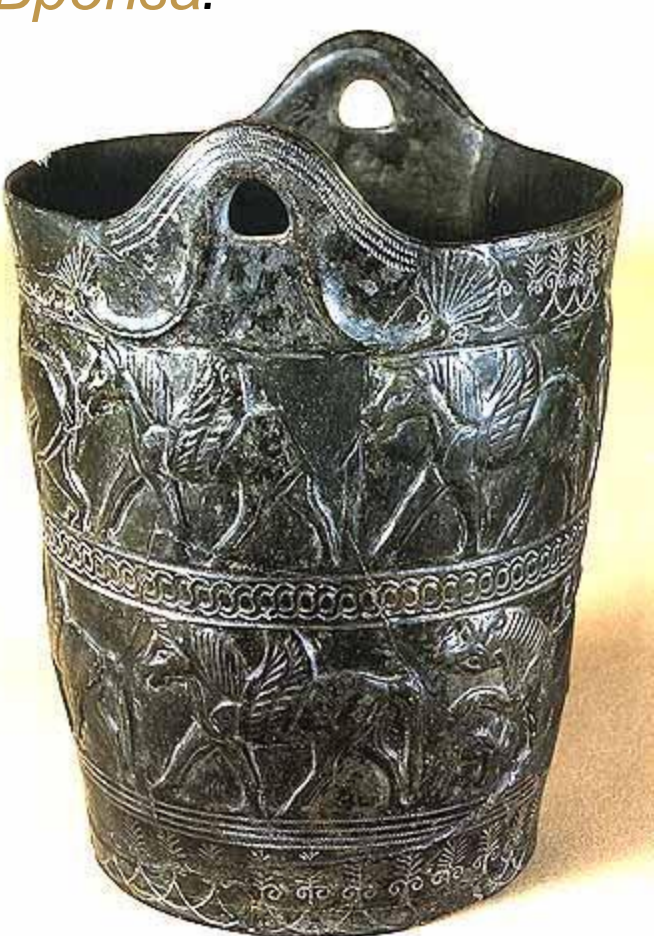
Ситула из гробницы в Кьюзи Бронза.