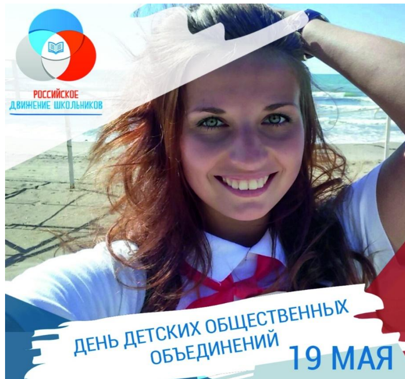
Маргарита Владиславовна Терехова