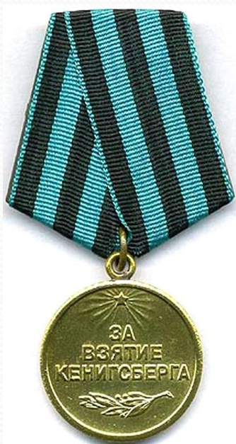
Медаль «За взятие Кенигсберга»