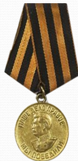
Медаль «За победу над Германией в Великой Отечественной войне 1941-1945гг».