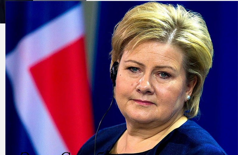
Эрна Сульберг, премьер-министр с 2013 г.