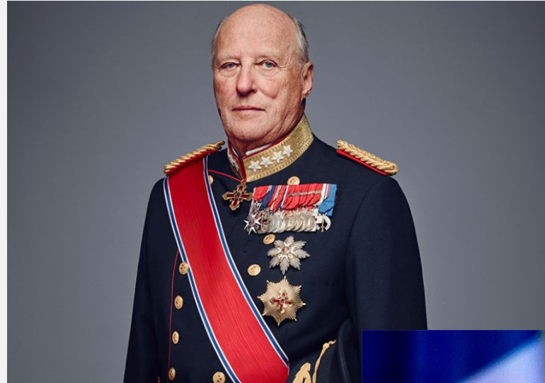
Харальд V, Король Норвегии с 1991 г.