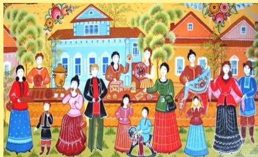
ГОРОДЕЦКАЯ РОСПИСЬ. КОНЬ- КАЧАЛКА.