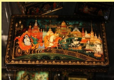
ФЕДОСКИНСКАЯ ЛАКОВАЯ МИНИАТЮРА. СВЕТЯЩИЕСЯ БРОШИ И ШКАТУЛКИ