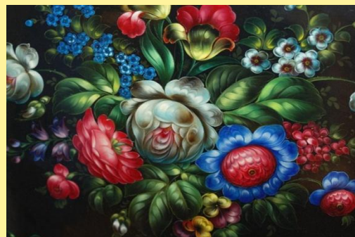
ЖОСТОВСКАЯ РОСПИСЬ. ПОДНОСЫ.