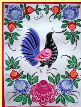
УРАЛО- СИБИРСКАЯ РОСПИСЬ. ПТИЦЫ