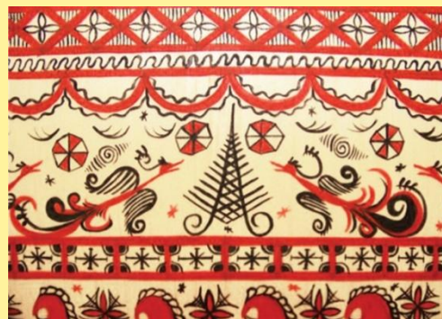
МЕЗЕНСКАЯ РОСПИСЬ. ТРИ ТИПА УЗОРОВ