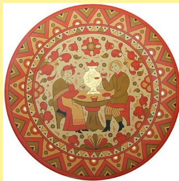
ПЕРМОГОРСКА Я РОСПИСЬ. КОЛОКОЛЬЧИК И