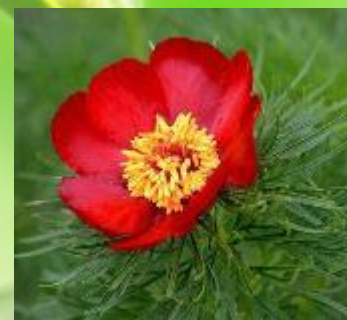
Пион тонколистный (воронец) занесен в Красную книгу РФ.