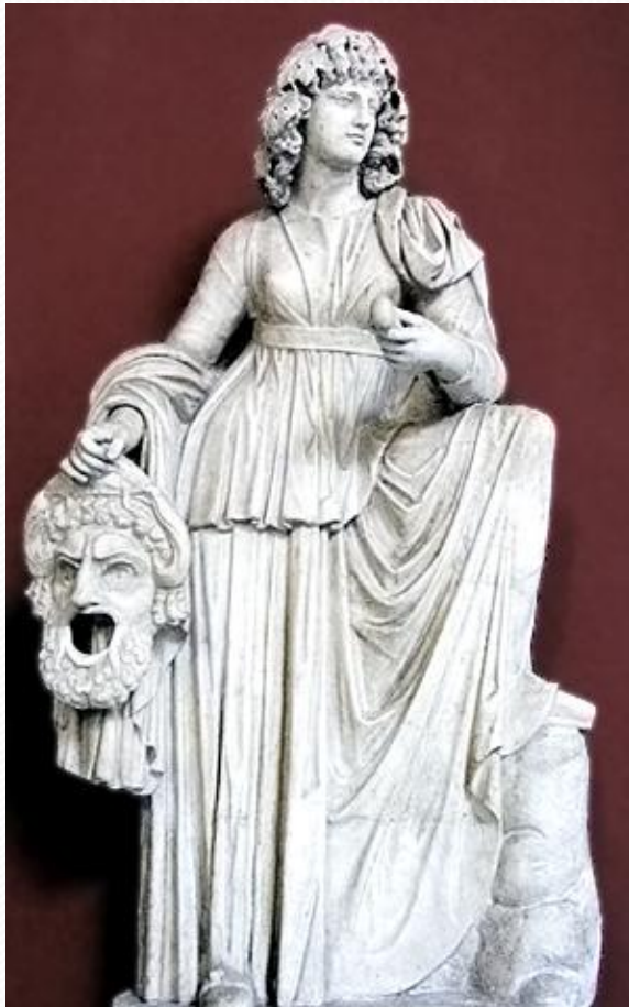
Мельпомена – муза трагедии

Очень часто древнегреческие авторы брали сюжеты для своих пьес из мифов .