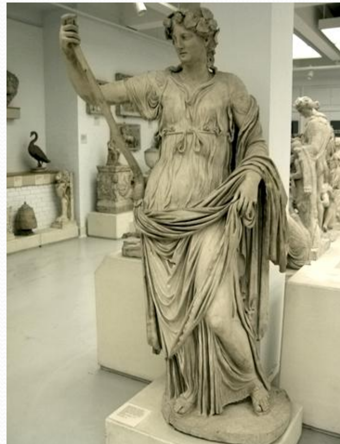
Талия – муза комедии