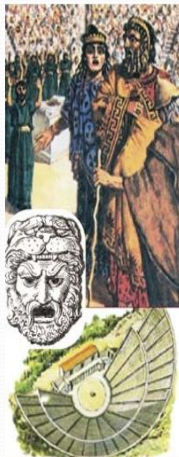
Театр Диониса в Афинах. Маски