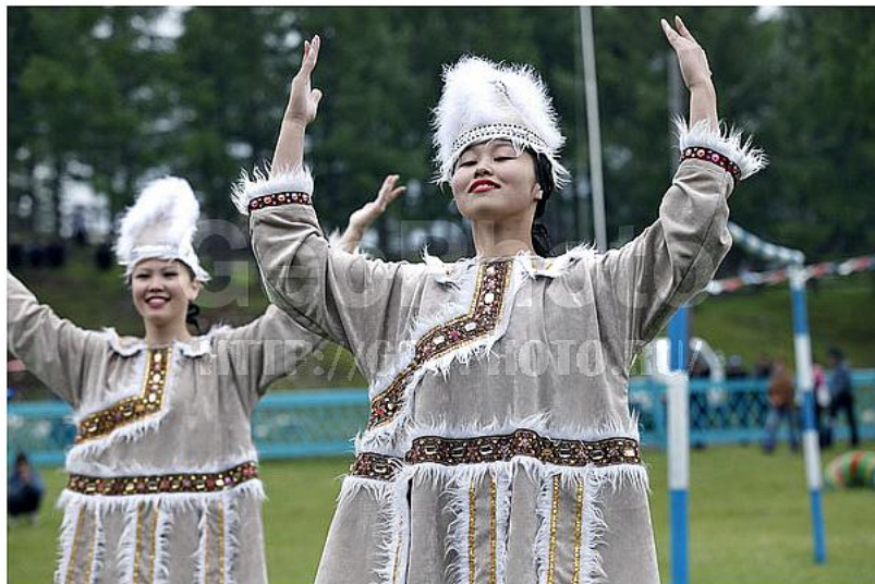
# gbr19075019 Russia, Buryat region Lentini Gabriele (C) GeoPhoto.Ru