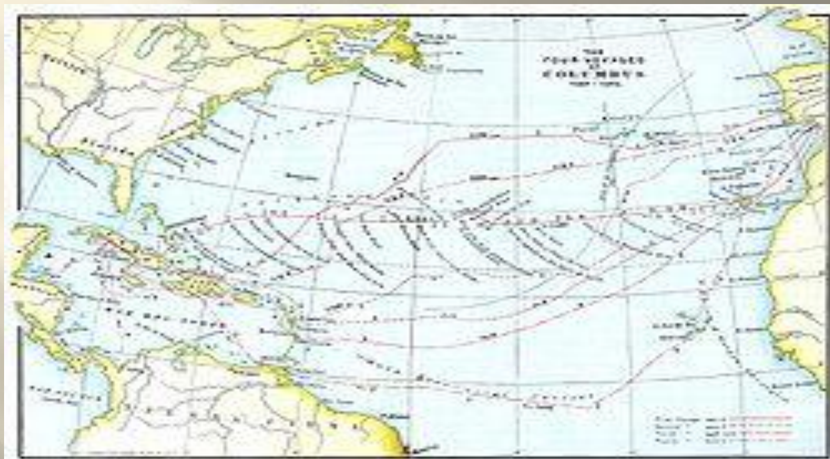
Карта четырёх экспедиций Колумба