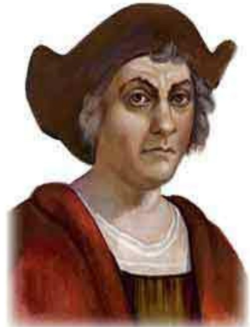
Христофор Колумб (1451-1506)

– мореплаватель, известный тем, что открыл Америку. Родился на острове Корсика.