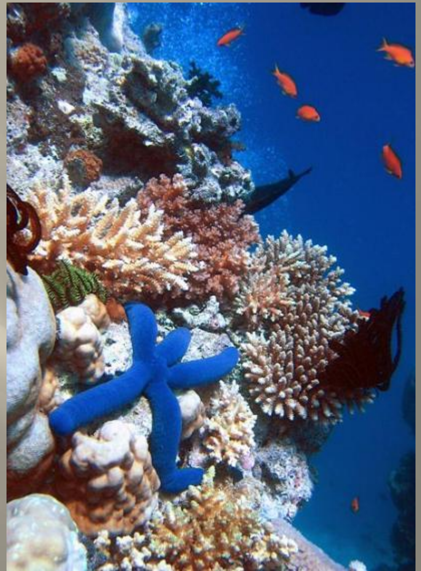
Большой Барьерный риф