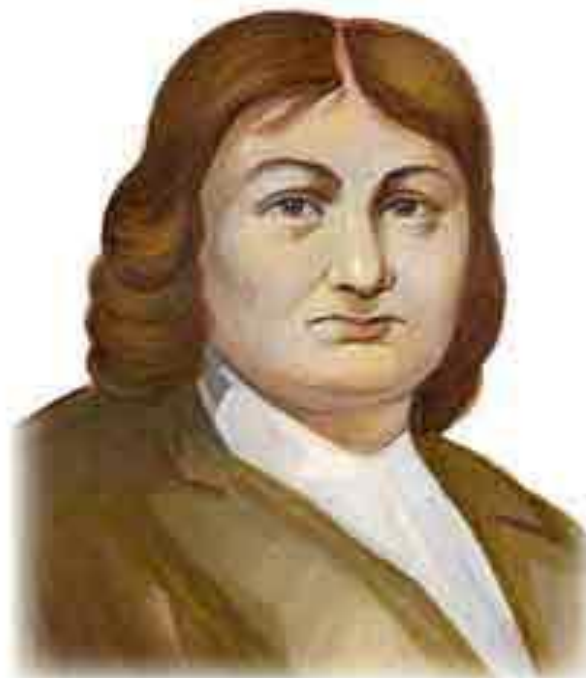
Витус Беринг (1681-1741)

родился в 1681 году в поселке Хорсенс, Дания в семье крестьянина