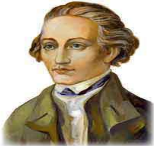
Джеймс Кук (1728-1779)

(1728 - 1779) – исследователь, мореплаватель, первооткрыватель, совершивший два кругосветных путешествия, картограф.