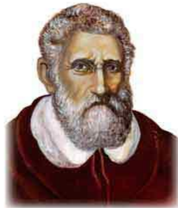
Марко Поло (1254-1324)