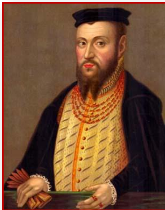
Сигизмунд II Август

Условия объединения Польши и ВКЛ были выработаны на Люблинском сейме, который состоялся в 1569 г. и длился 6 месяцев. Польская сторона стремилась к инкорпорации (включение, присоединение) ВКЛ в состав Польни (Короны), опираясь на католических феодалов и католическую церковь. Делегация ВКЛ во главе с канцлером ВКЛ Николаем Радзивиллом Рыжим выступала за заключение равноправного союза с Польшей. Польской стороне на сейме удалось добиться от Сигизмунда II Августа значительных территориальных уступок.