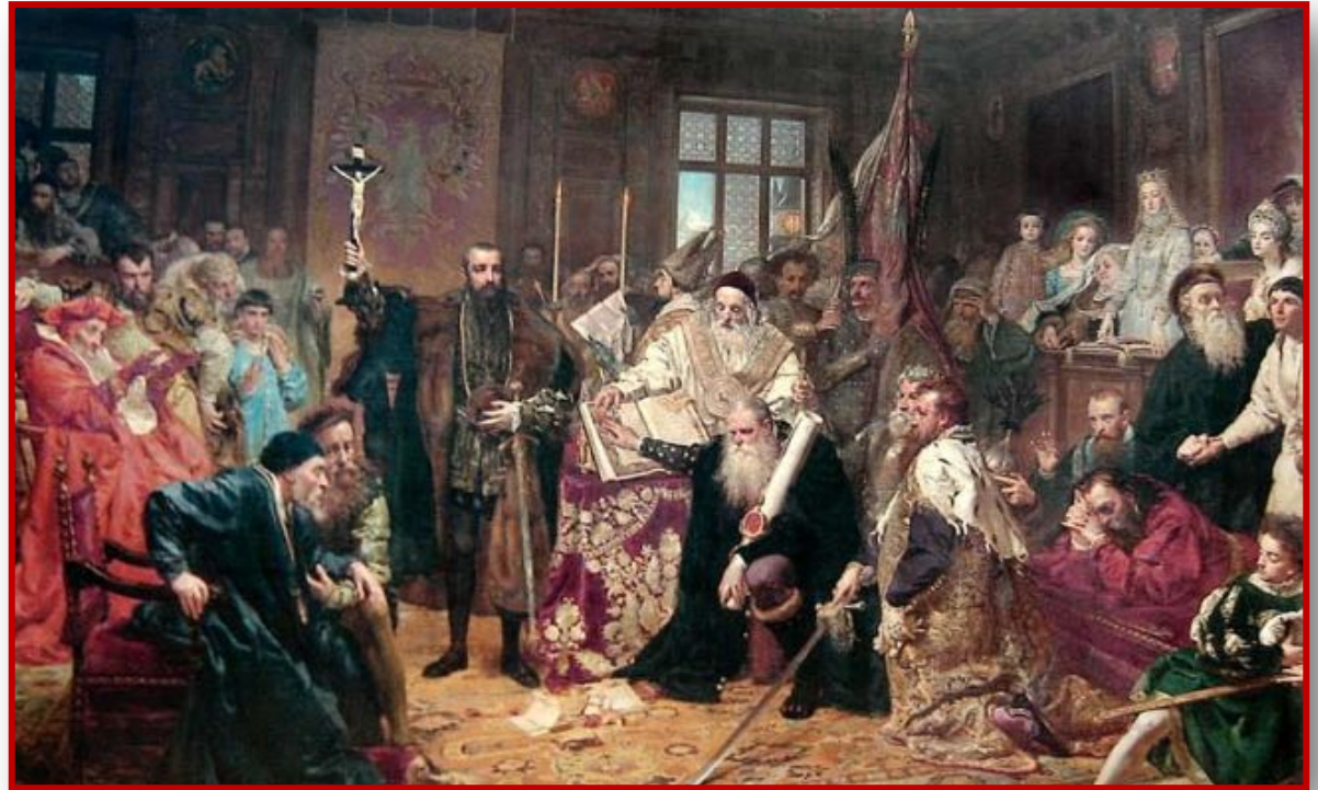
Люблинская уния. Худ. Я.Матейко

Итоги Люблинской унии обусловили политическое положение ВКЛ в составе Речи Посполитой. Ряд богатейших земель были включены в состав Польши, из-за чего территория ВКЛ существенно уменьшилась. Итоги Люблинской унии вызвали недовольство большей части магнатов ВКЛ, которым нужно было делить политическую власть с поляками. К тому же согласно унии польская шляхта имела право получать земельные владения в пределах ВКЛ, а шляхта ВКЛ практически утратила такое право в районах, присоединённых к Польскому королевству.