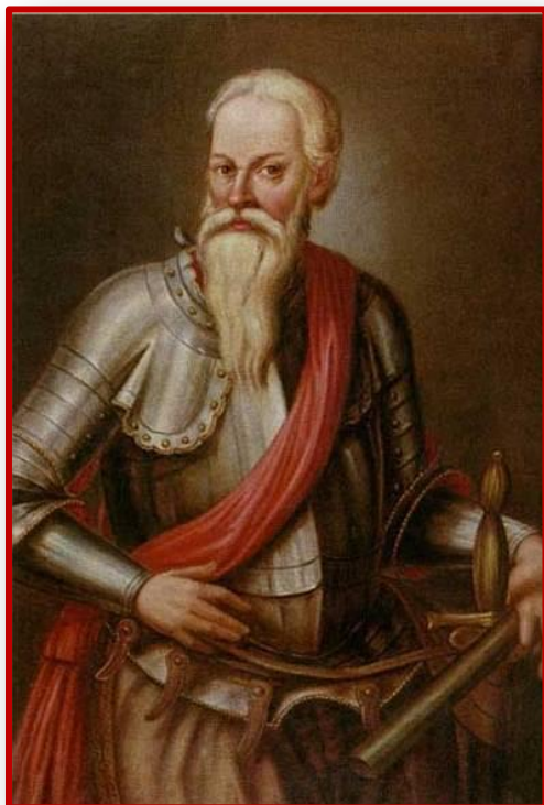
Николай Радзивилл Рыжий