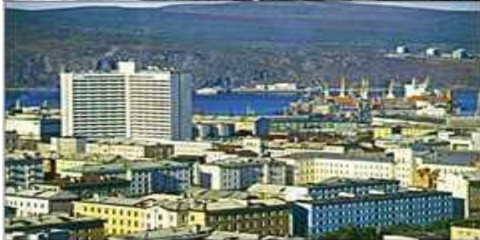
Мурманск. Вид на порт