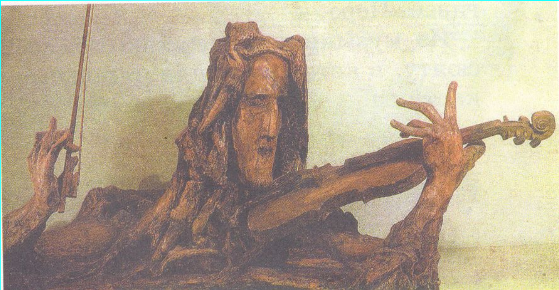
С. Коненков «Паганини»