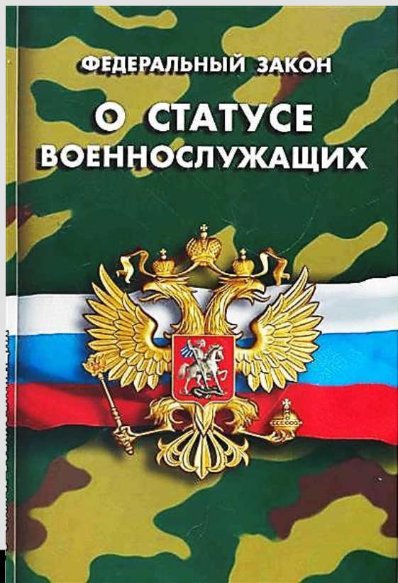
Федеральный ЗАКОН ОТ 06.03.1998

Воинская обязанность — обязанность граждан России проходить военную подготовку в рядах Вооружённых сил РФ.