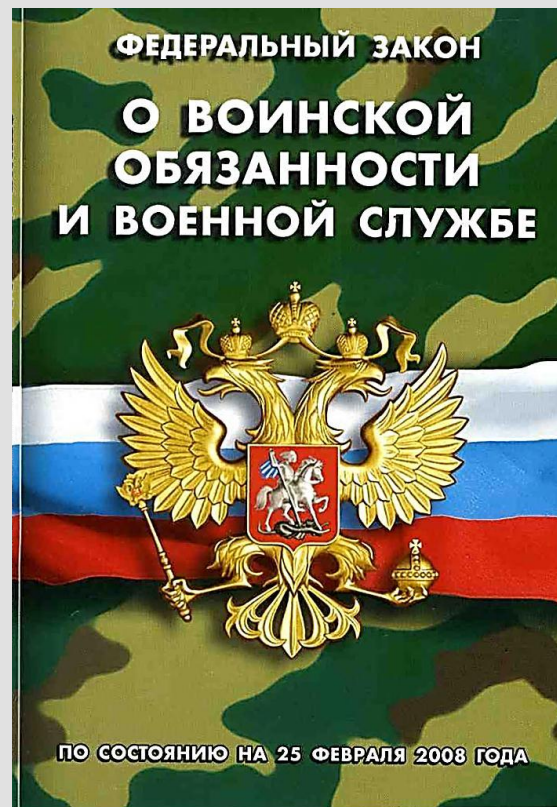
Федеральный закон от 28.03.1998 N 53-ФЗ (ред. от 03.07.2016)