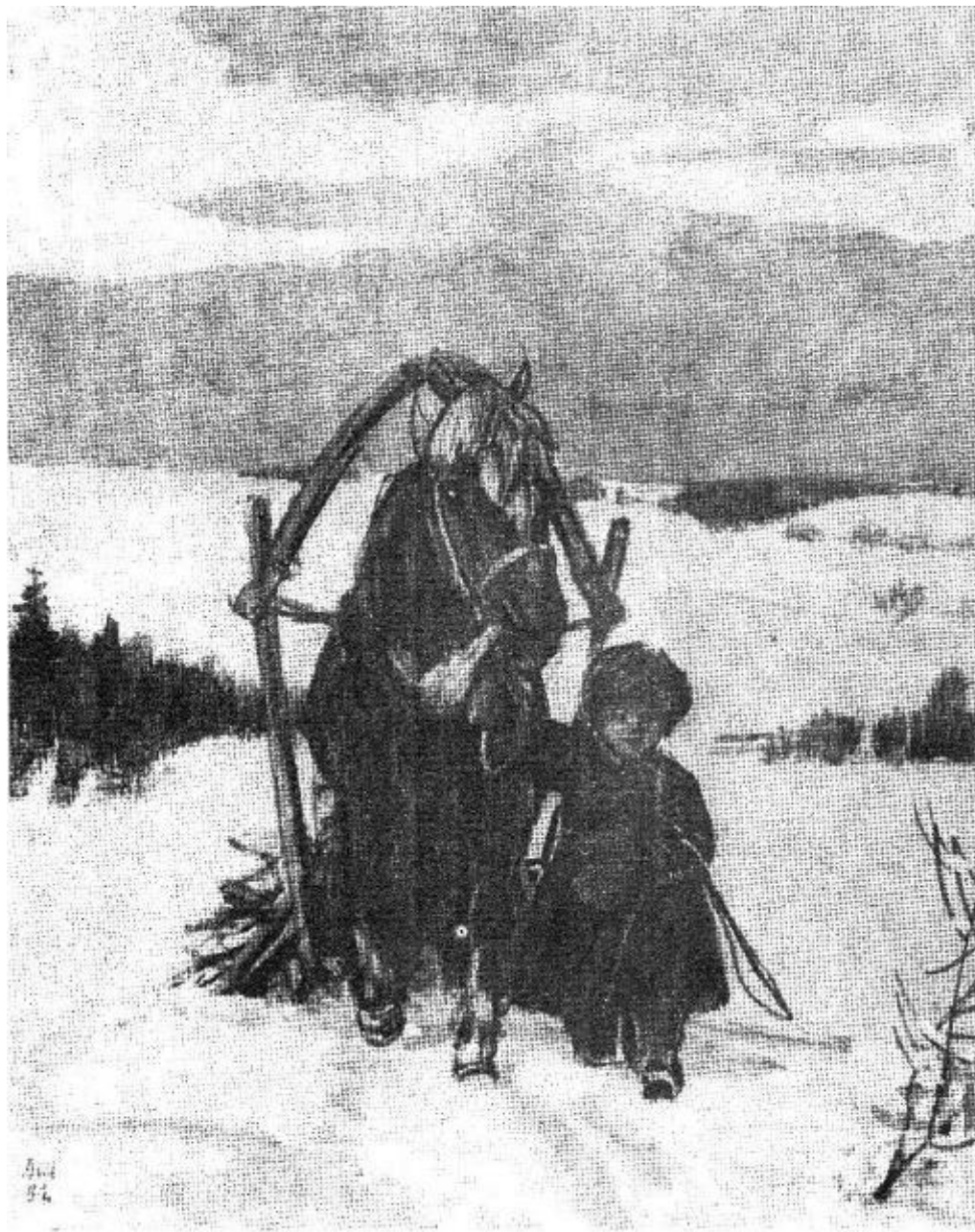
«Мужичок с ноготок» Художник Д.А. Шмаринов