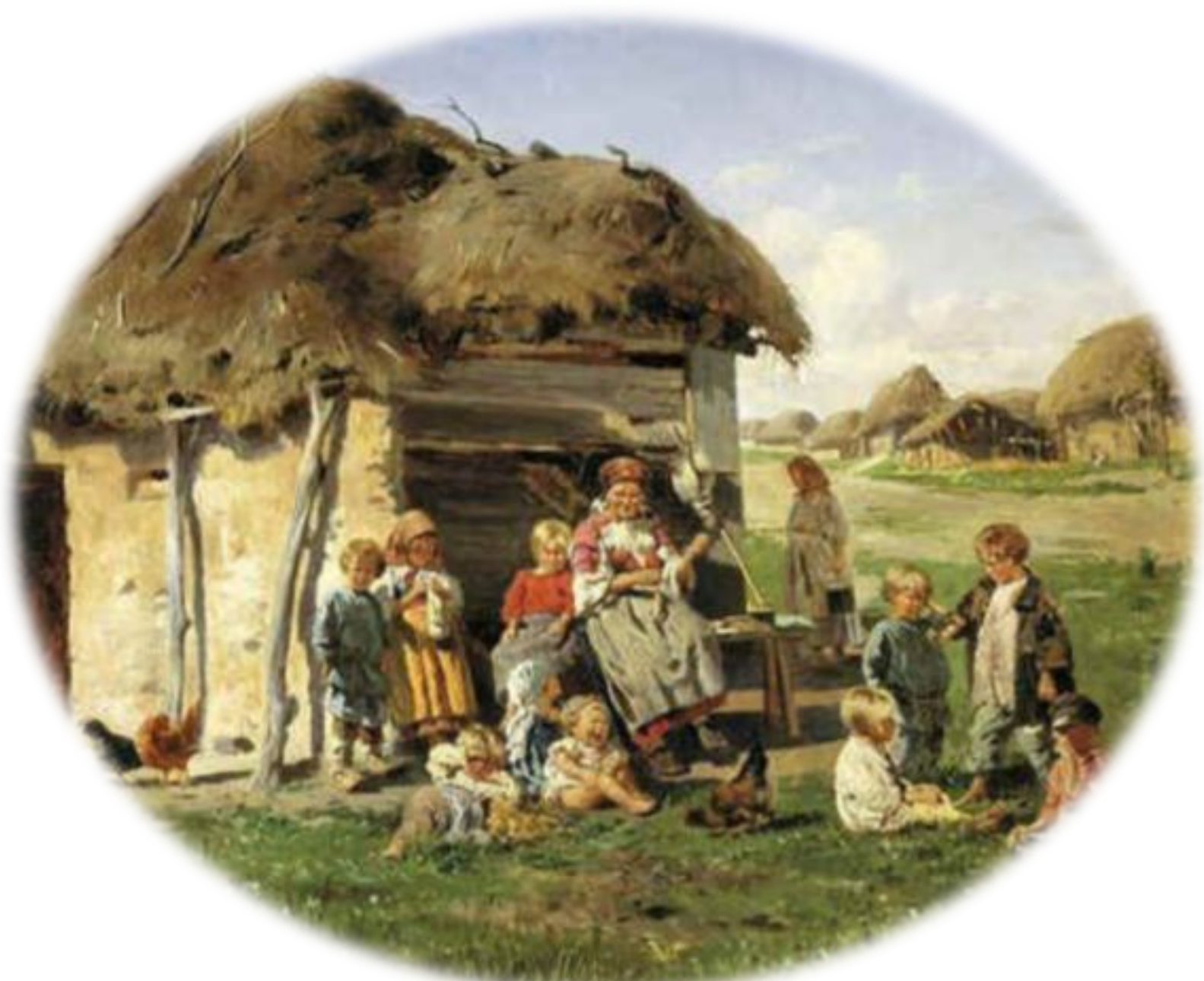
В.Маковский. Крестьянские дети