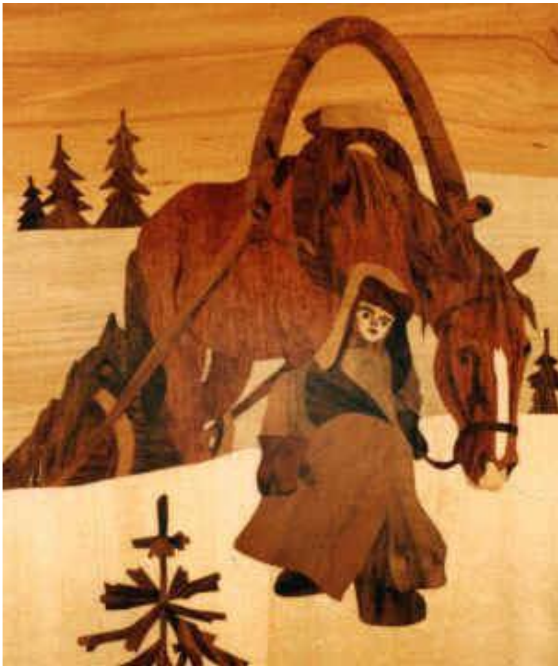
«Мужичок с НОГОТОК» Художник И. ЗИНОВЬЕВ