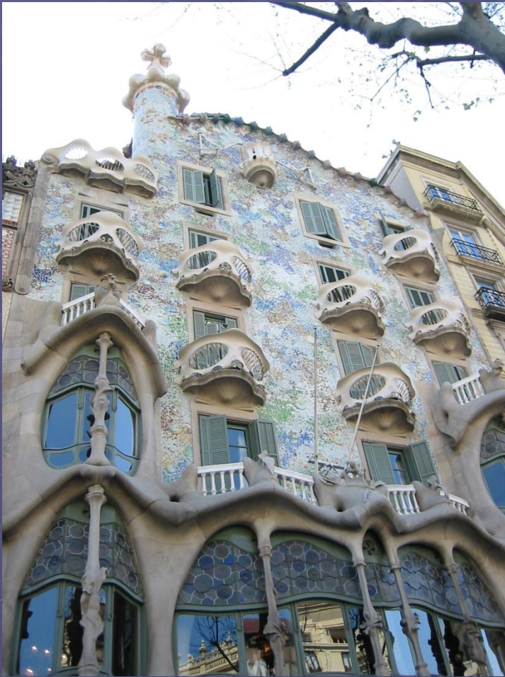
Дом Бальо (1906)