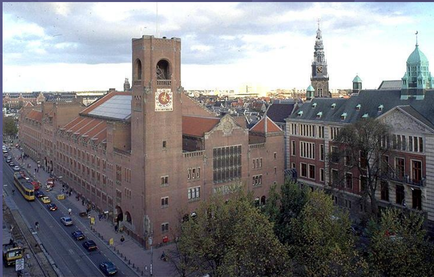
Биржа Берлаге. Амстердам