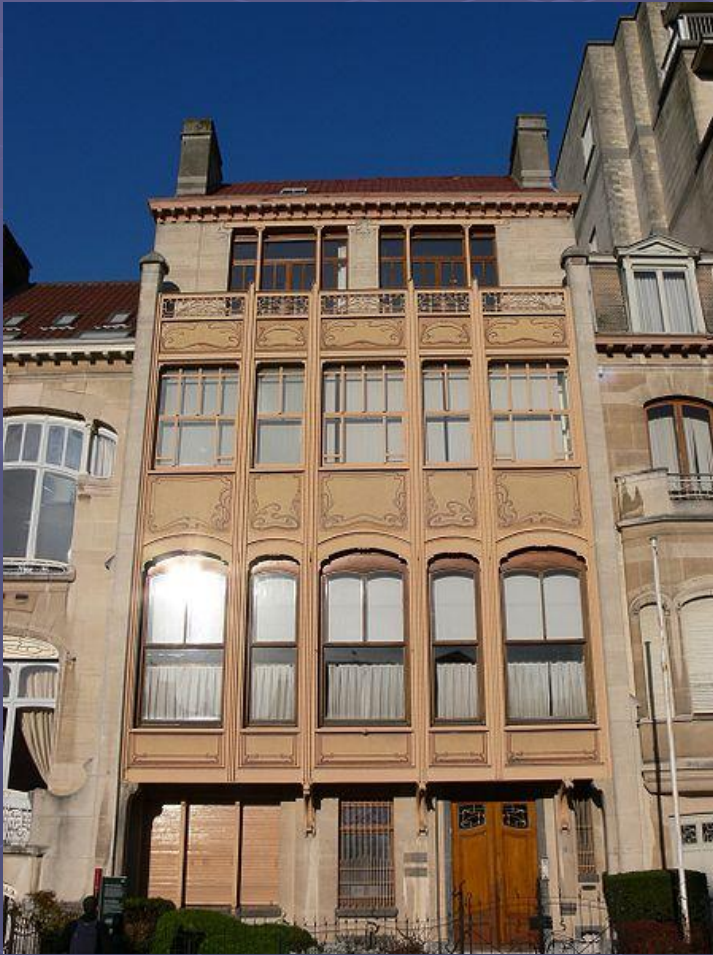
Отель ван Этвельде