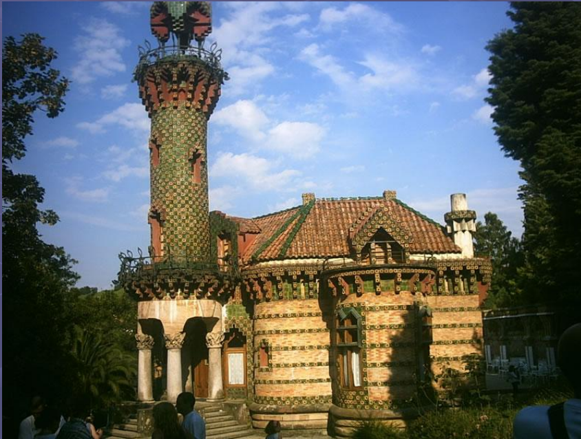
Эль-Каприччо (1885) (Комильяс, Кантабрия)