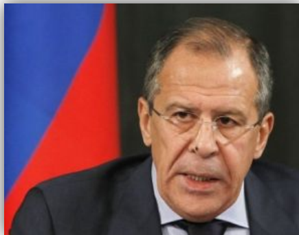
постоянный представитель России при ООН - Сергей Лавров

Организация Объединённых Наций была создана 24 октября 1945 года. Союз Советских Социалистических Республик был одной из стран-основателей организации и ее членом с момента учреждения ООН.