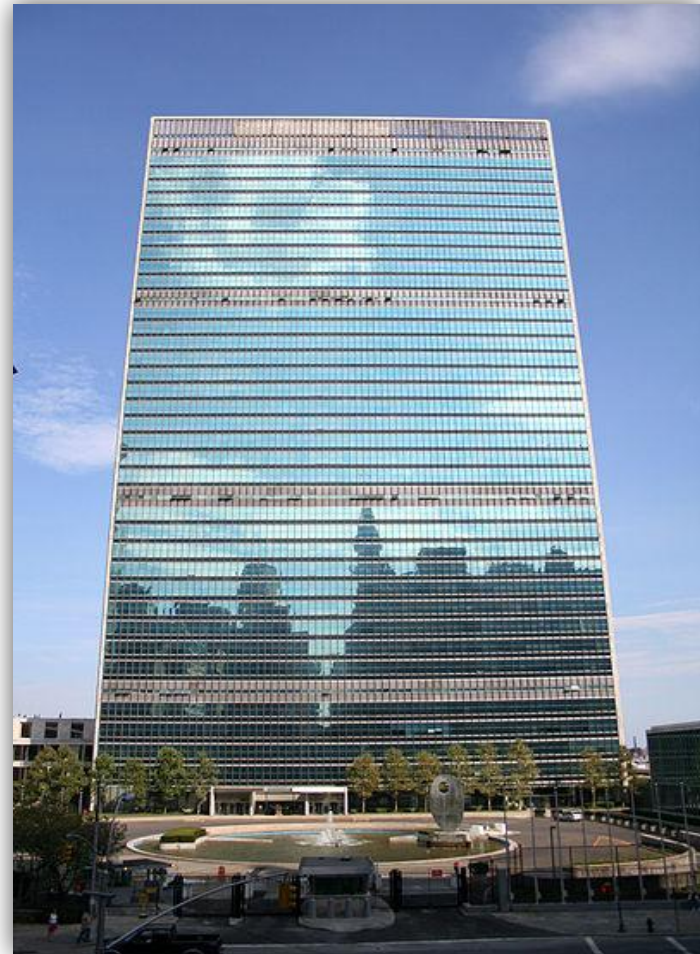
Штаб-квартира ООН в Нью-Йорке

Это уникальное международное сообщество, имеющее целью способствовать поддержанию и укреплению мира, экономическому и социальному прогрессу всех стран и народов.